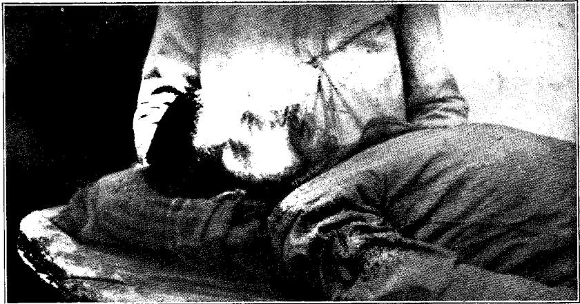
Неизвѣстный, убит гайдамаками на ст. Ромодан (Доставлено в еврейское министерство Миргородским общинным совѣтом)