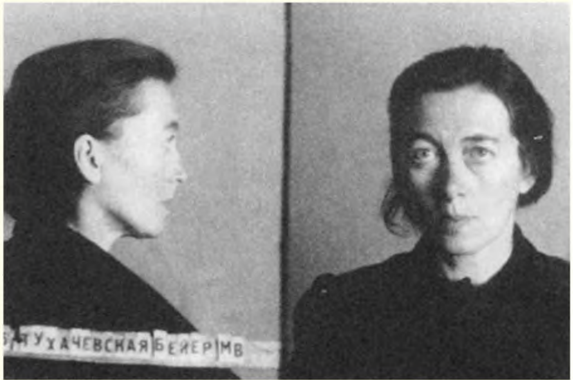
М. В. Бейер-Тухачевская. Тюремное фото. 1938 г. Ц А Ф С Б Р Ф . А С Д № Р-5159. Публикуется впервые.