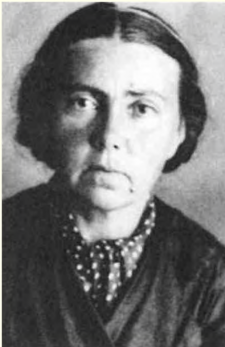
Н. В. Уборевич. Тюремное фото. 1939 г. Публикуется впервые.