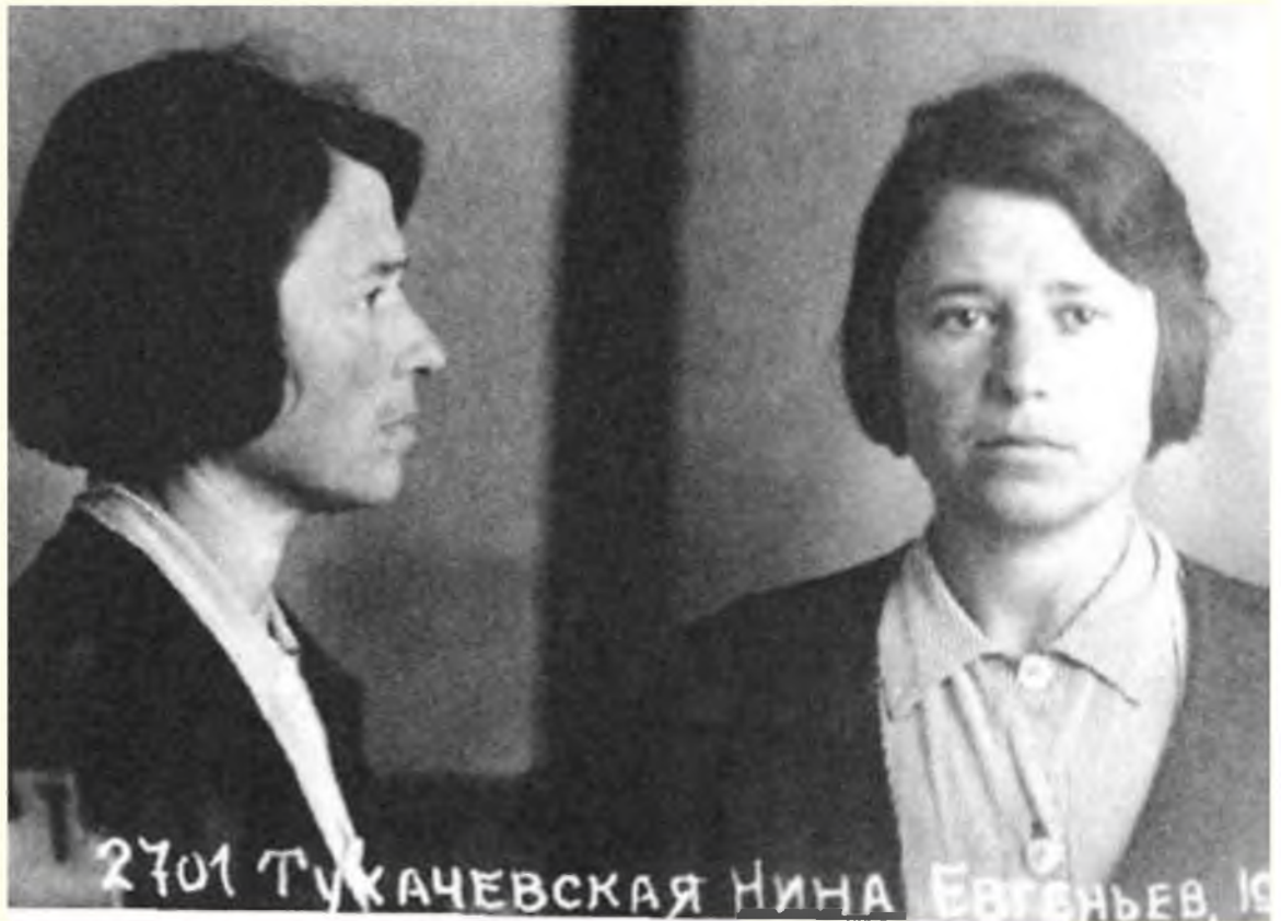
Н. Е. Тухачевская. Тюремное фото. 1937 г. АСД № Р-23914. Публикуется впервые.