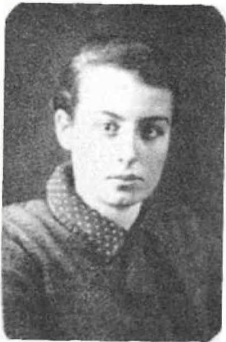
В. Я. Гамарник. 1937 г. Публикуется впервые.