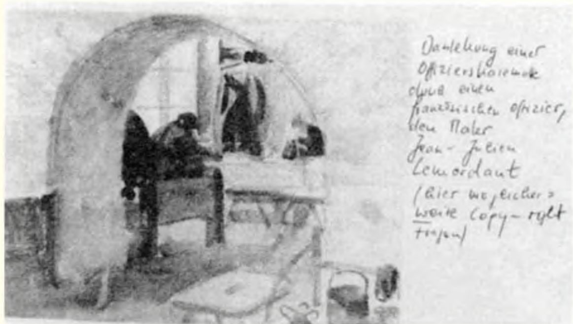
Офицерская мастерская. Лагерь Ингольштадт. Рисунок одного из французских пленников офицеров. 1916 (?) г.