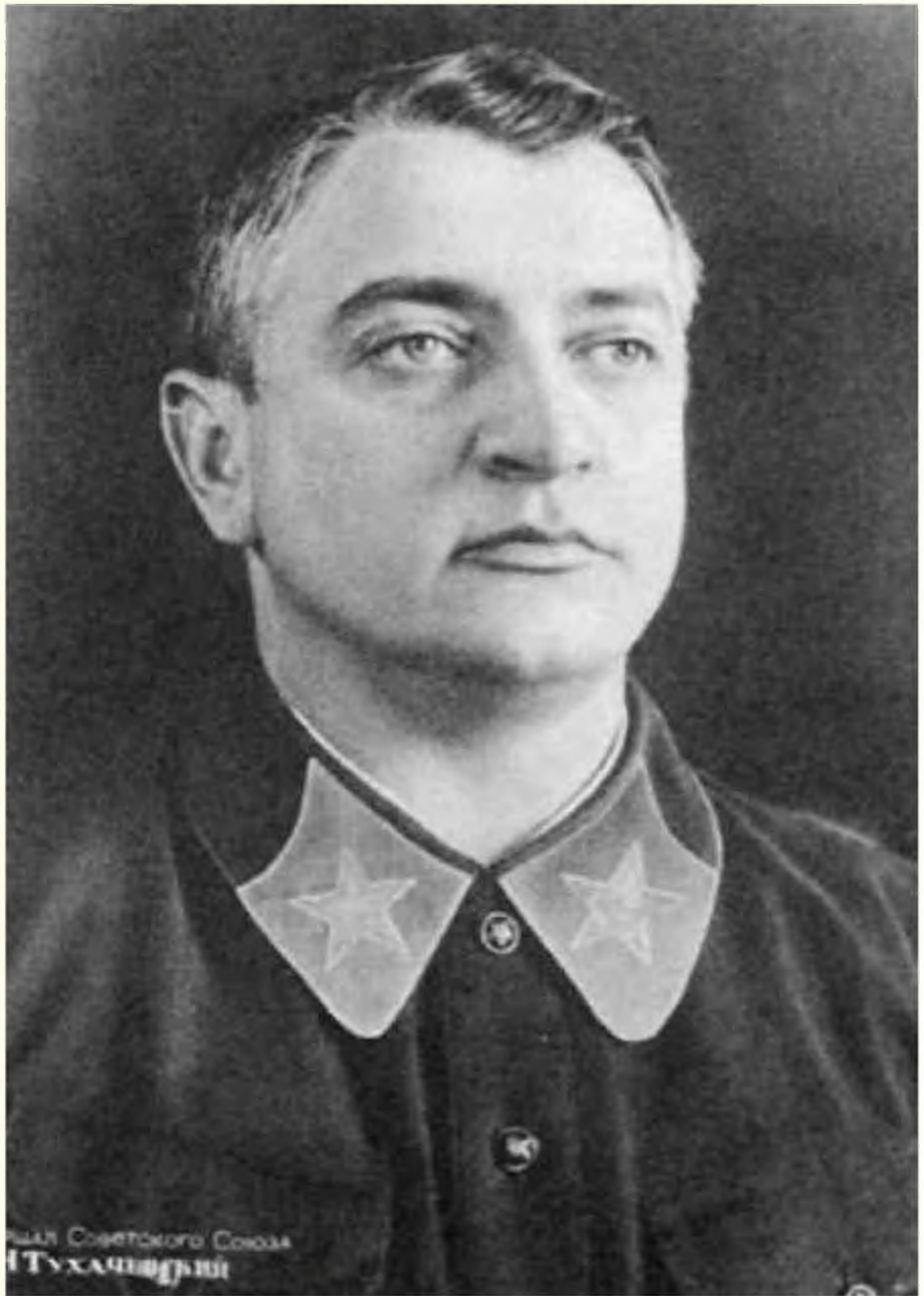
Генерал Советского Союза Г. Г. Тухачевский