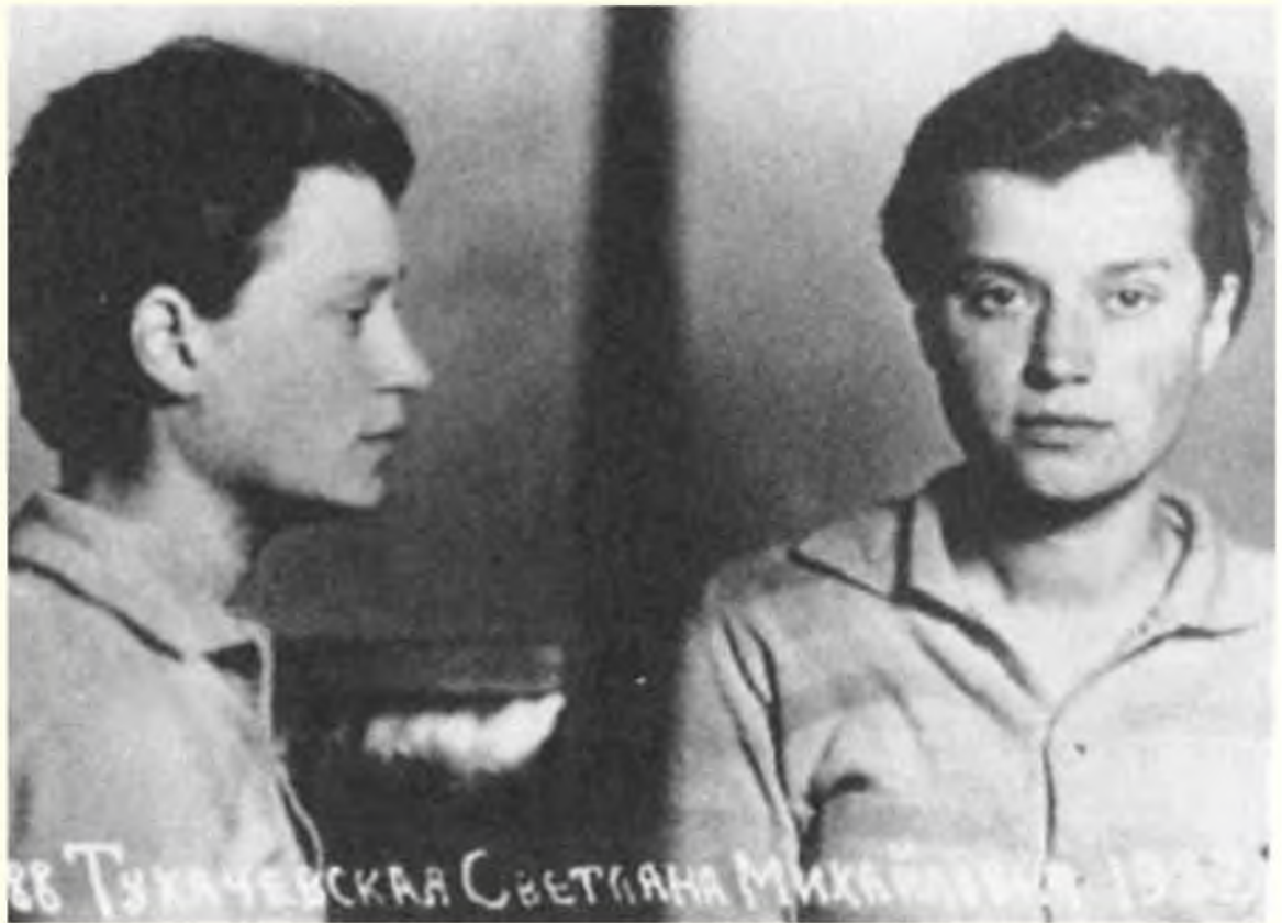
С. М. Тухачевская. Тюремное фото. 1944 г. ЦА ФСБ РФ. АСД № Р-41897. Публикуется впер- вые.