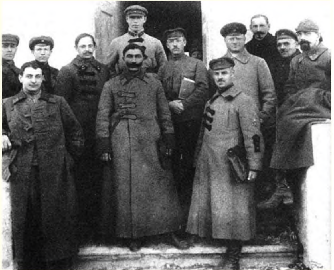
Советские военачальники. 1921 г. В первом ряду: крайний слева - М. Н. Тухачевский; в центре - С. М. Буденный; крайний справа - П. Е. Дыбенко.