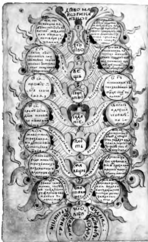
Изображение Майориканского дерева. Рукопись «Великой науки Раймунда Люллия». XVIII в. (Древлехранилище Института русской литературы (Пушкинский Дом) РАН).