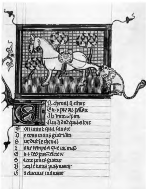
Миниатюра средневекового «Бестиария» (Парижская Национальная библиотека).