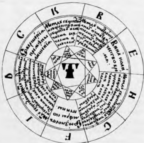
Фигура «Т». Рукопись «Великой науки Раймунда Люллия». XVIII в. (Древлехранилище Института русской литературы (Пушкинский Дом) РАН).

Второйъ . Фирма прилагемыхъ раз- смотряемыхъ :