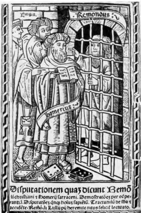
Спор Льюля с мусульманским теологом Амаром. Иллюстрация из валенсийского издания 1510 г. сочинения Льюля «Спор Раймунда-христианина с Амаром-сараценом».