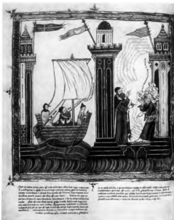
Первое путешествие Льюя в Тунис. Миниатюра средневековой рукописи (Муниципальная библиотека г. Карлсруэ).