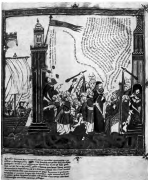
Диспут Льюля с мусульманскими теологами, избиение его и заключение в тюрьму. Миниатюра средневековой рукописи (Муниципальная библиотека г. Карлсруэ).