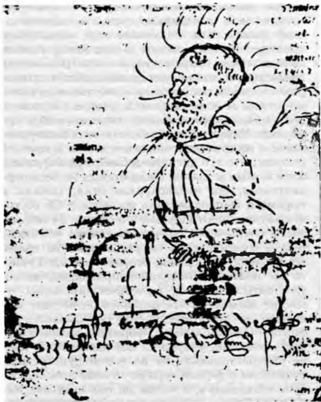
Предполагаемое изображение Рамона Льюля. Рисунок на полях рукописи романа «Книга об Эвасте и Бланкерне» (Парижская Национальная библиотека).