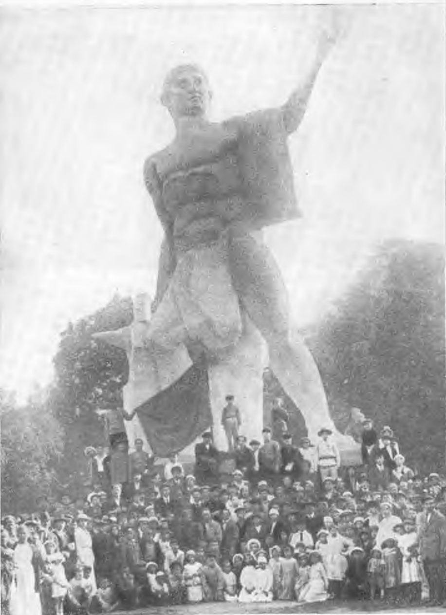
И. И. Лепсе среди красноармейцев и рабочих на Каменном острове в Петрограде у памятника Освобожденному труду. 1920 г.