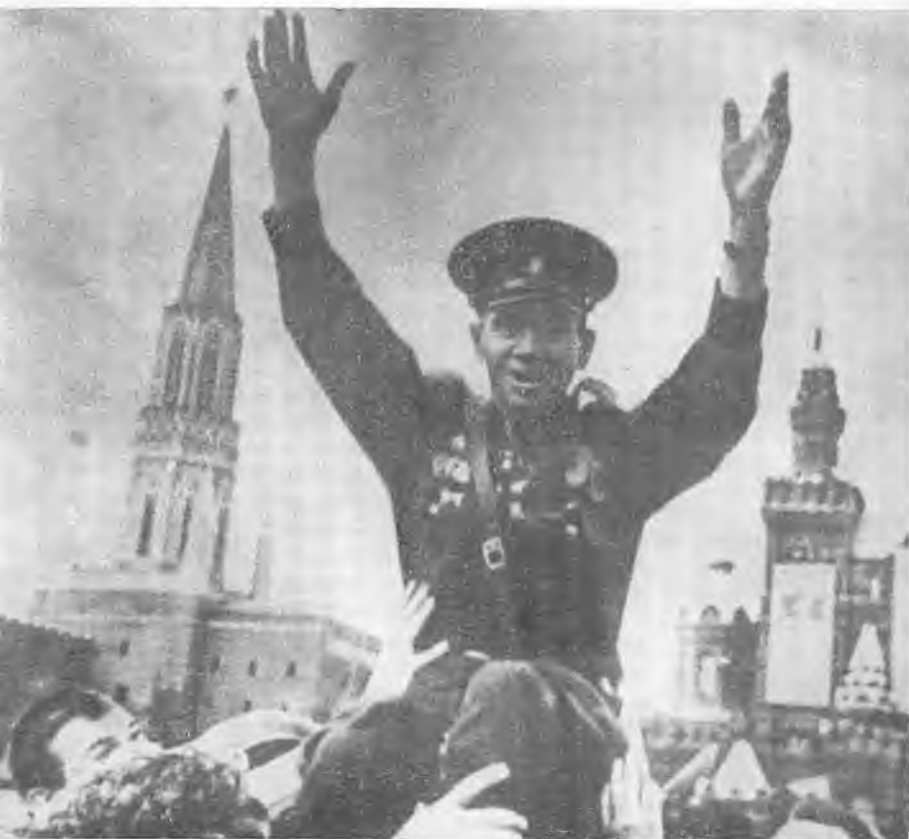
Герой боя у Дубосекова И. Шадрин на Красной площади в День Победы. 1945 г.