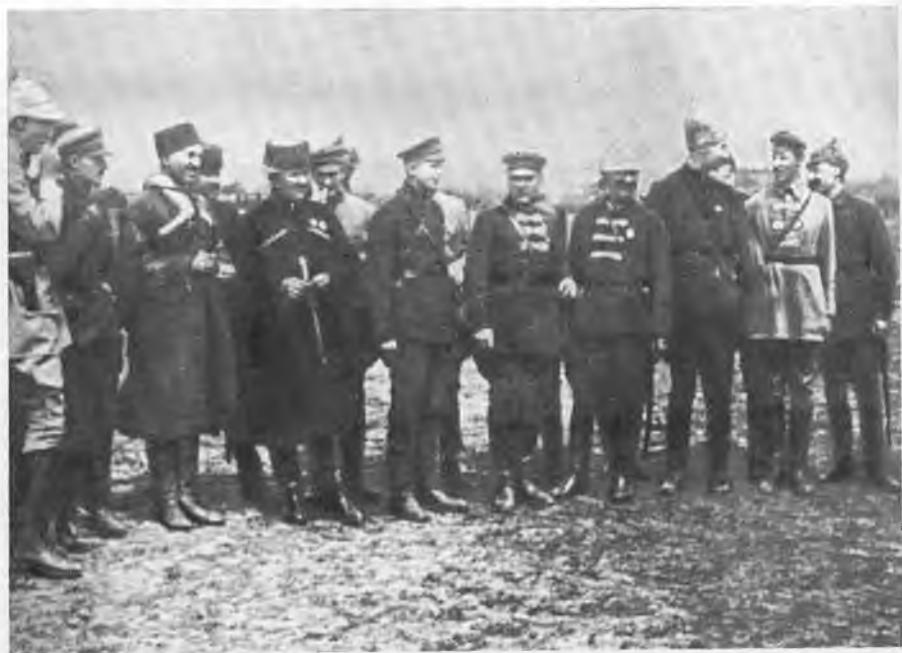
А. С. Бубнов, К. Е. Ворошилов, С. М. Буденный среди бойцов Первой Конной армии. 1919 г.