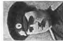
Комиссары Бакинской коммуны.