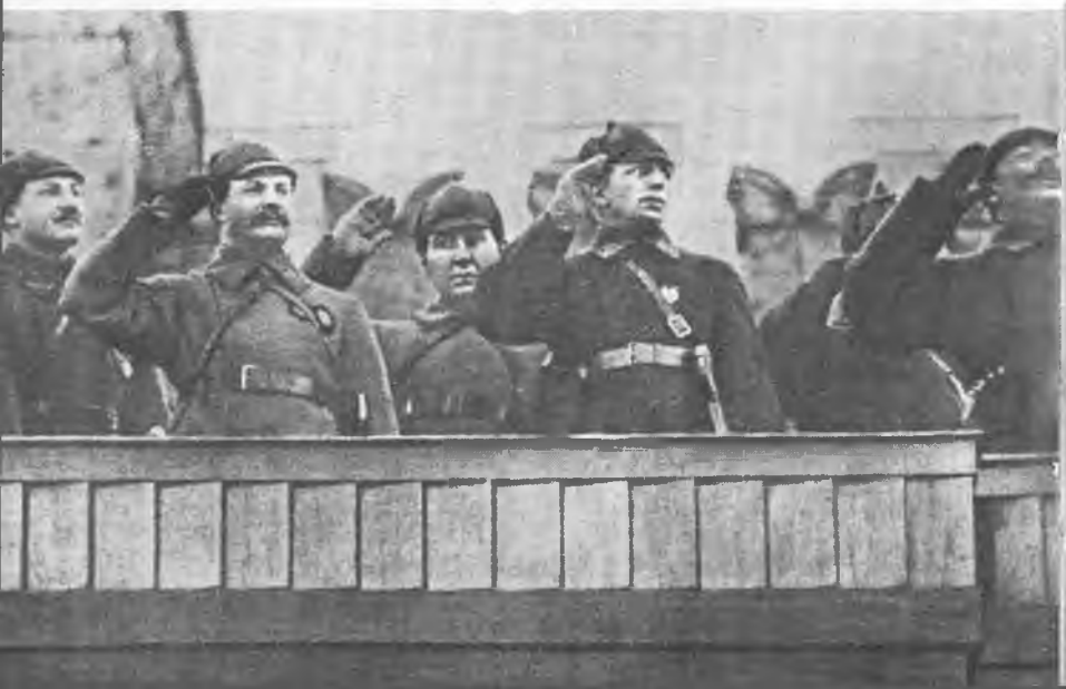
М. В. Фрунзе, А. С. Бубнов, С. М. Буденный во время военного парада на Красной площади в Москве. 1924 г.