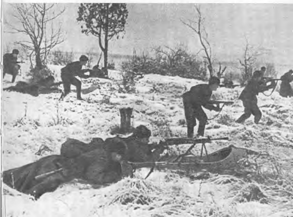
Танфиловцы в бою. 1941 г.