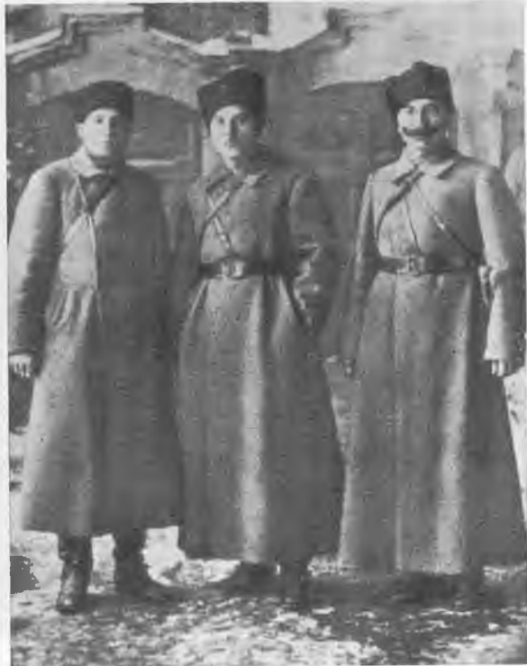
А. С. Бубнов, К. Е. Ворошилов, С. М. Буденный в годы гражданской войны. 1919 г.