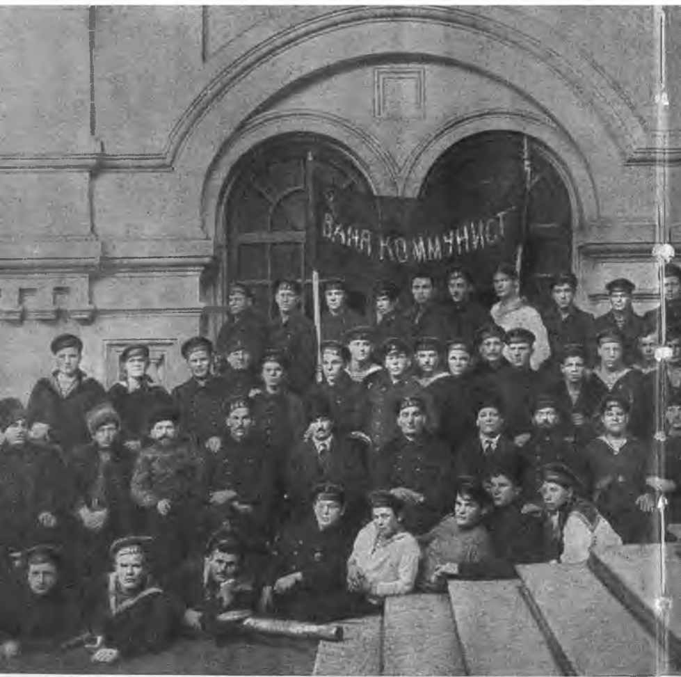
Группа моряков с канонерской лодки «Ваня-коммунист», 1918 г.