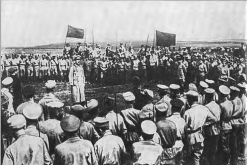
Н. И. Подвойский выступает на красноармейском митинге. Южный фронт, 1918 г.