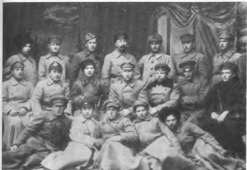
И. И. Лепсе (во втором ряду четвертый справа) и Я. Ф. Фабрициус (в третьем ряду четвертый справа) с членами реввоенсовета, комиссарами и командирами 7-й армии. Псков, 1919 г.