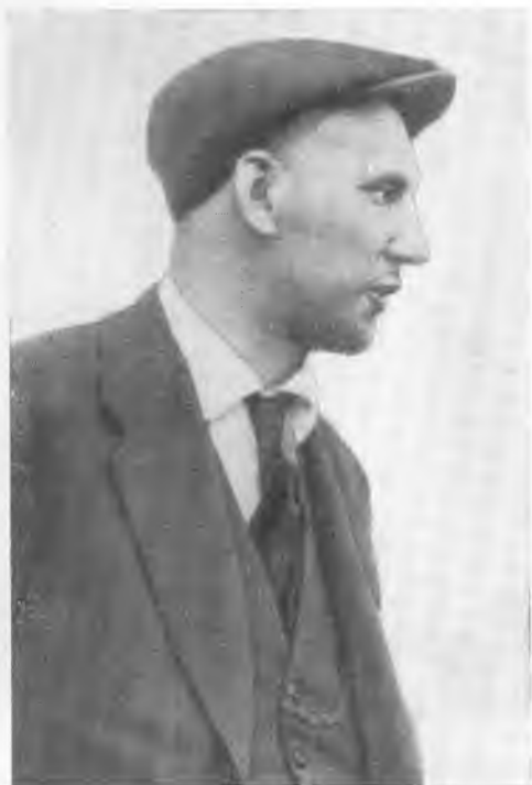
И. И. Лепсе. 1926 г.