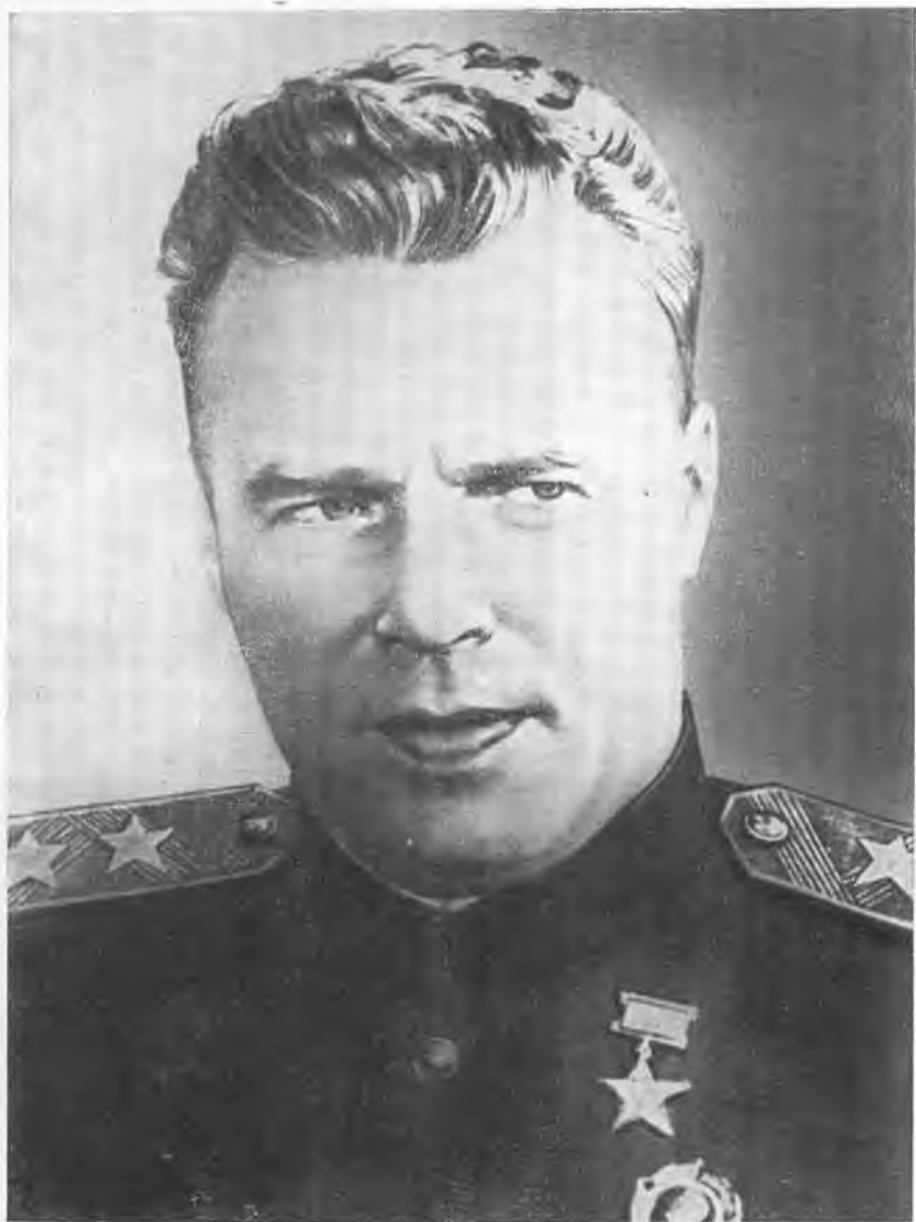
А. И. Шахурин в годы Великой Отечественной войны.

Москва. Красная площадь. Парад Победы. 1945 г. ►