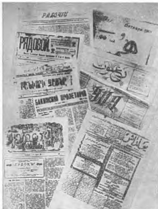
Большевистская печать Азербайджана.