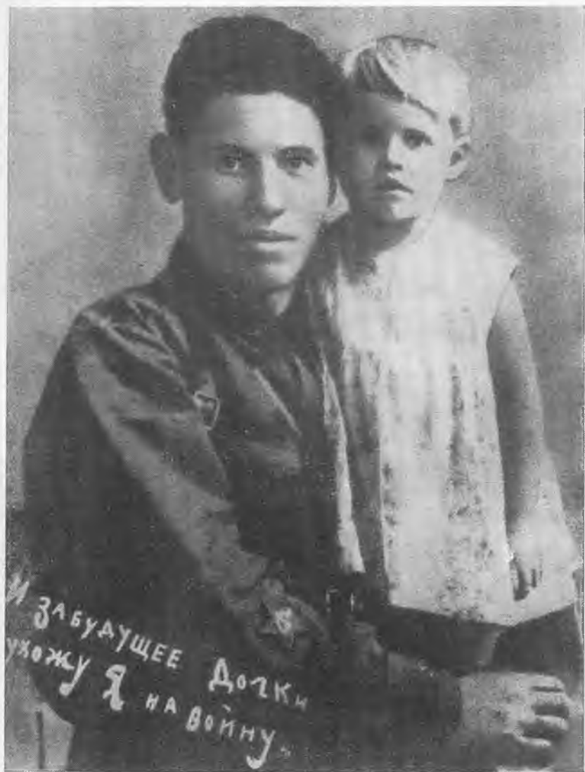
В. Г. Клочков. 1941 г.