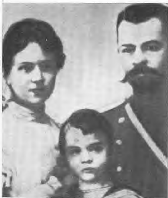
А. М. Коллонтай с мужем и сыном. 1897 г.