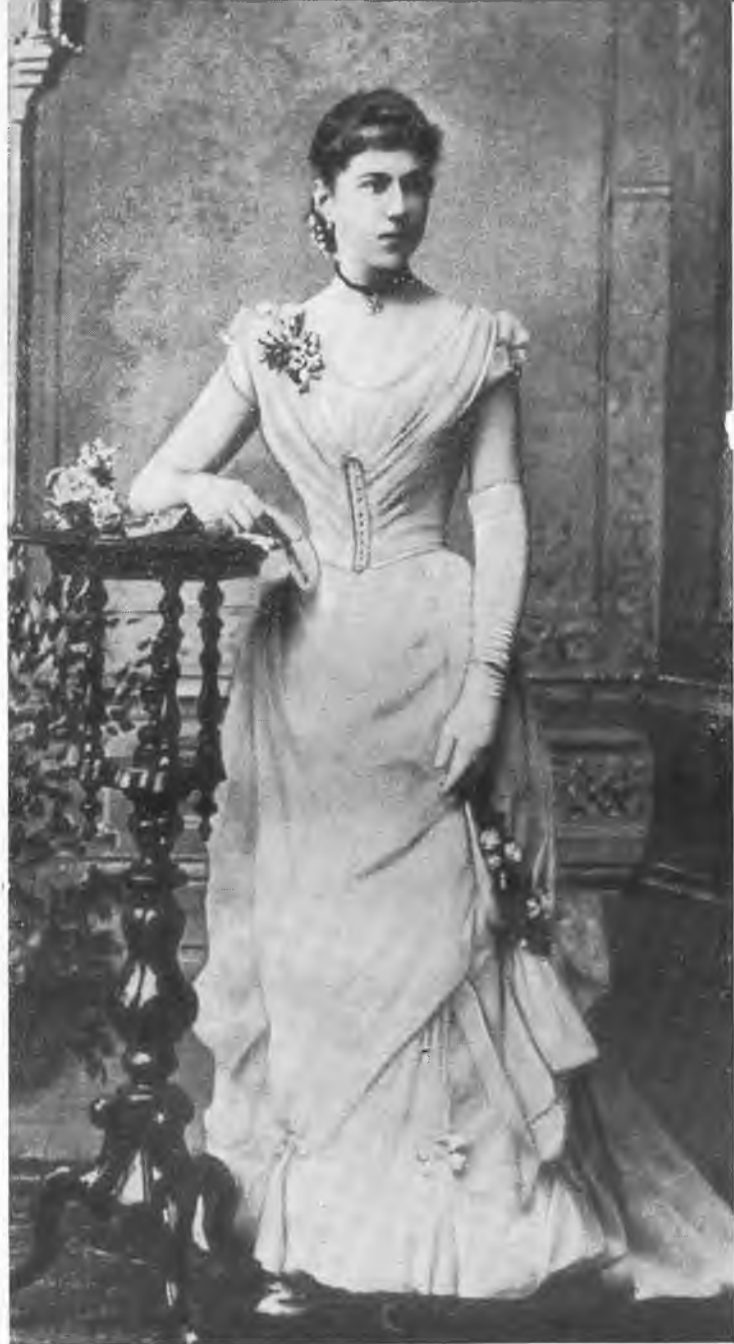
А. М. Коллонтай. 1889 г