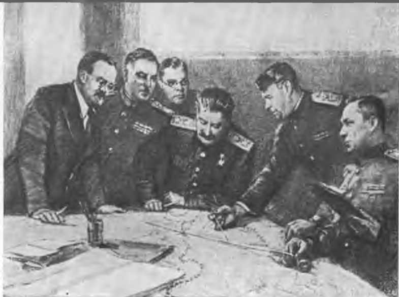
«Обсуждение плана операции». Картина художника К. И. Финогенова.