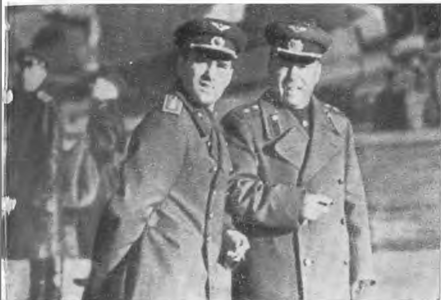
А. И. Шахурин и главный инженер Военно-Воздушных Сил А. К. Репин на летном поле. 1943 г.