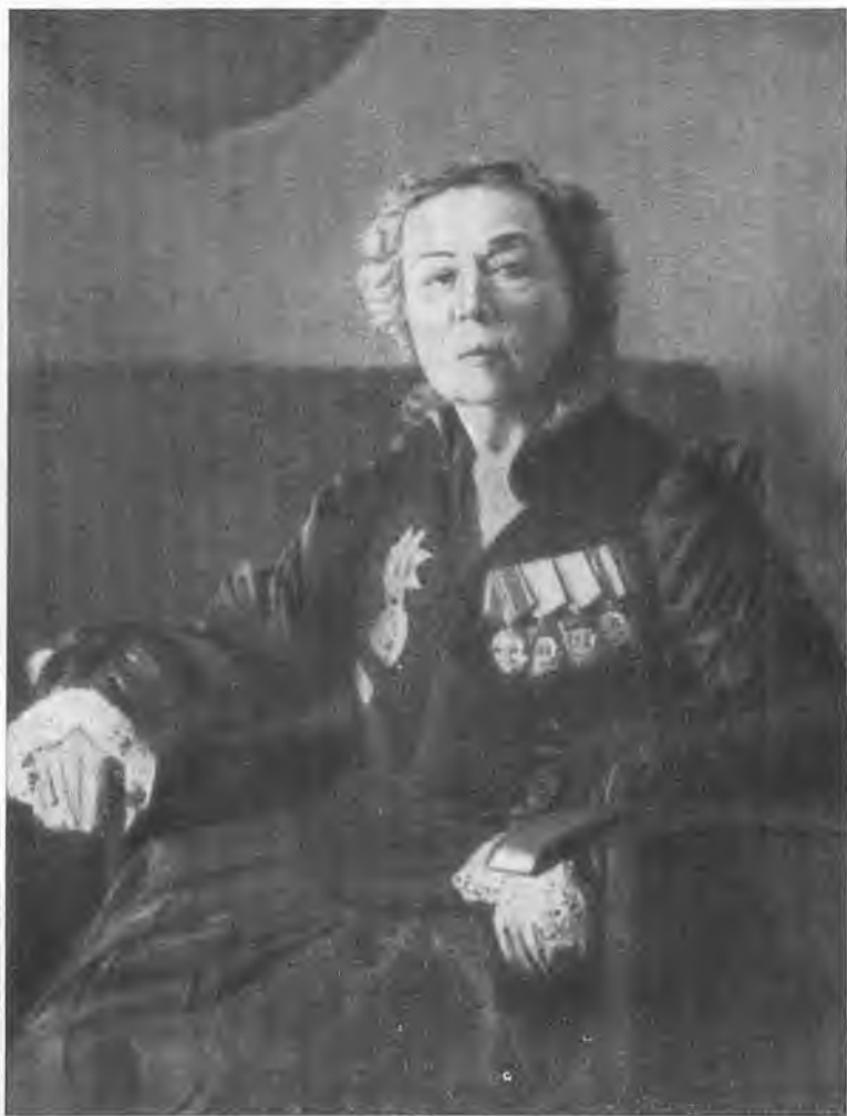
А. М. Коллонтай. 1952 г.