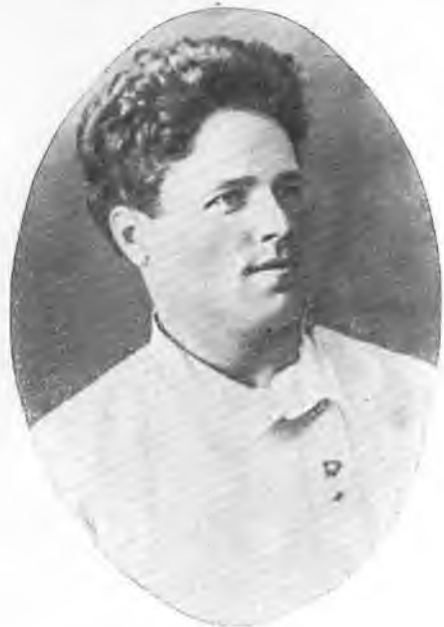
А. И. Шахурин. 1925 г.

Парторг ЦК ВКП(б) А. И. Шахурин (п е р в ы й с п р а в а) и Герой Советского Союза Э. Т. Кренкель (т р е т и й с п р а в а) среди работников завода № 1 имени Авиахима. 1937 г.