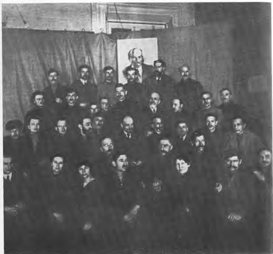
В. И. Ленин с делегатами IX съезда РКП(б). А. С. Бубнов — первый справа во втором ряду. 1920 г.