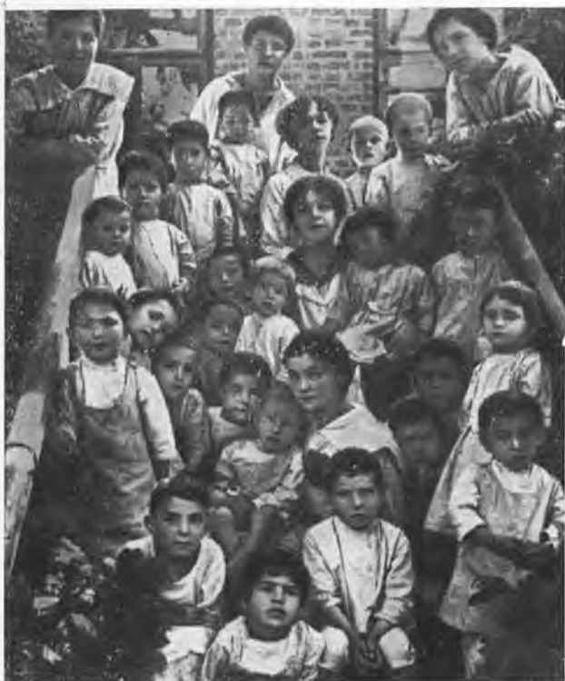
А. М. Коллонтай (в верхнем ряду, в центре) среди детей детского сада ее имени во время эвакуации из Киева. 1919 г.