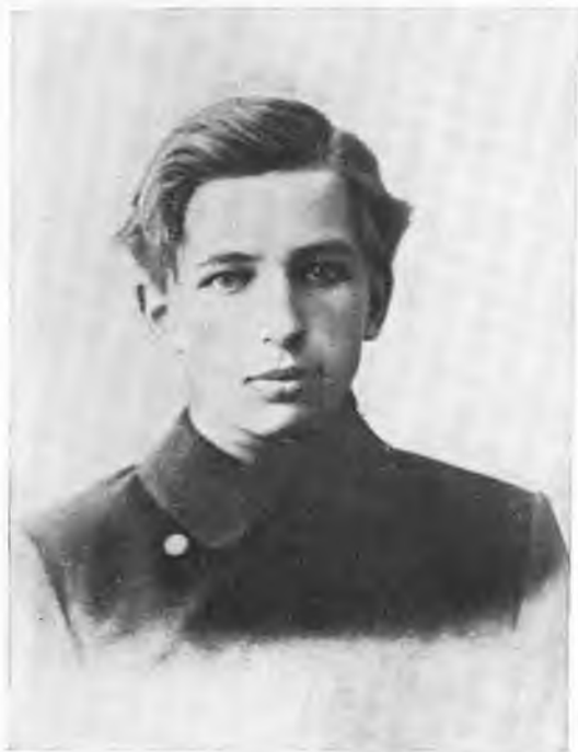
А. С. Бубнов. 1903 г.