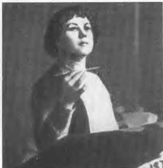
А. М. Коллонтай на трибуне II Международной конференции коммунисток. 1921 г.