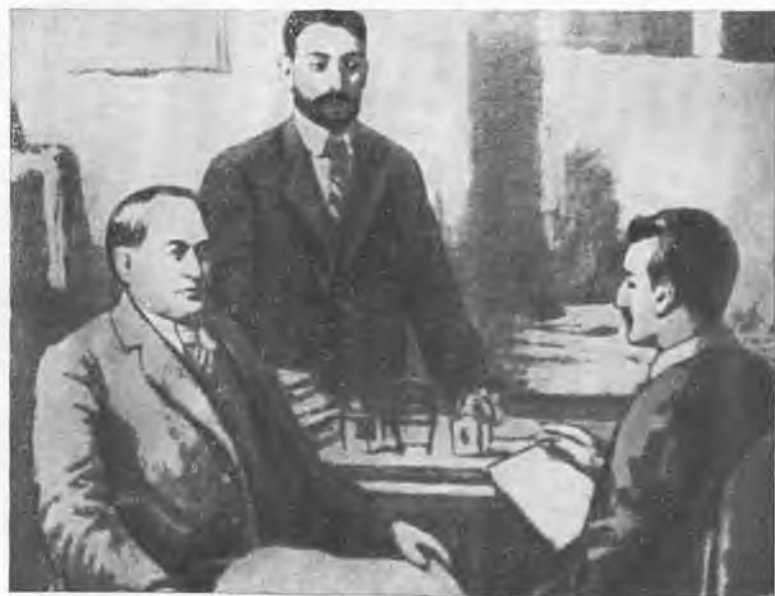
В редакции газеты «Гуммет».