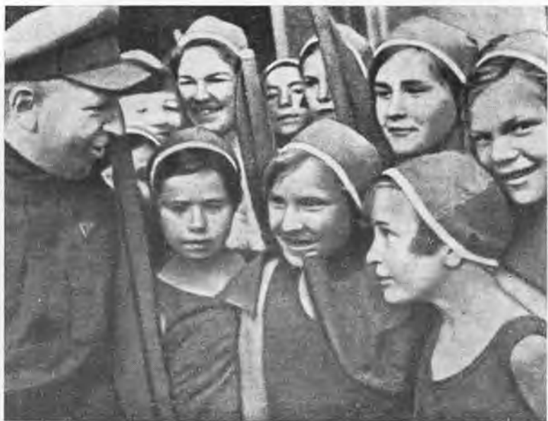
Нарком просвещения РСФСР А. С. Бубнов с пионерами. 1934 г.