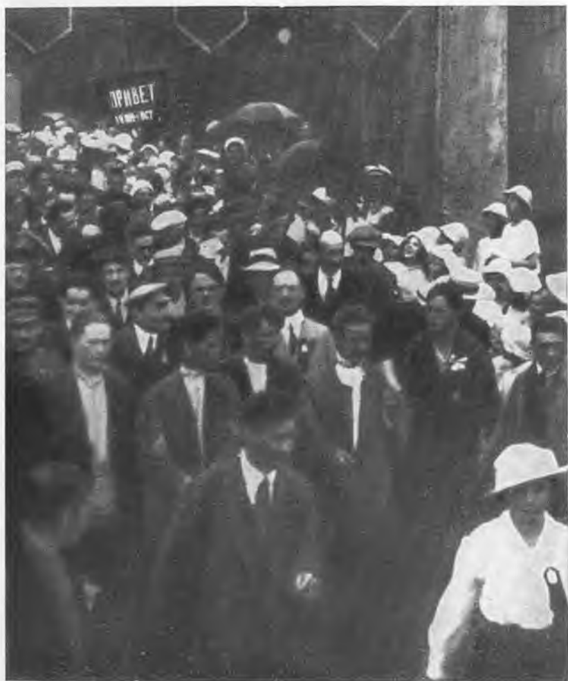
В. И. Ленин в колонне делегатов II конгресса Коминтерна, направляющихся на площадь Жертв Революции (Марсово поле) на церемонию возложения венков на могилы. 1920 г.