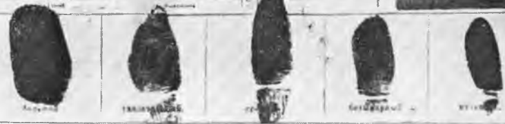
«Дело» А. С. Бубнова из картотеки полицейского управления. 1916 г.