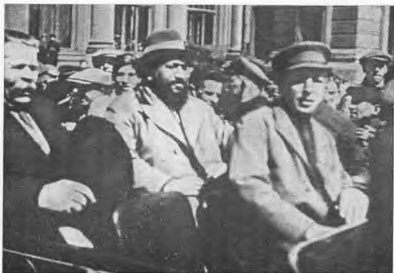
А. С. Бубнов на встрече А. М. Горького, приехавшего из Италии. 1928 г.