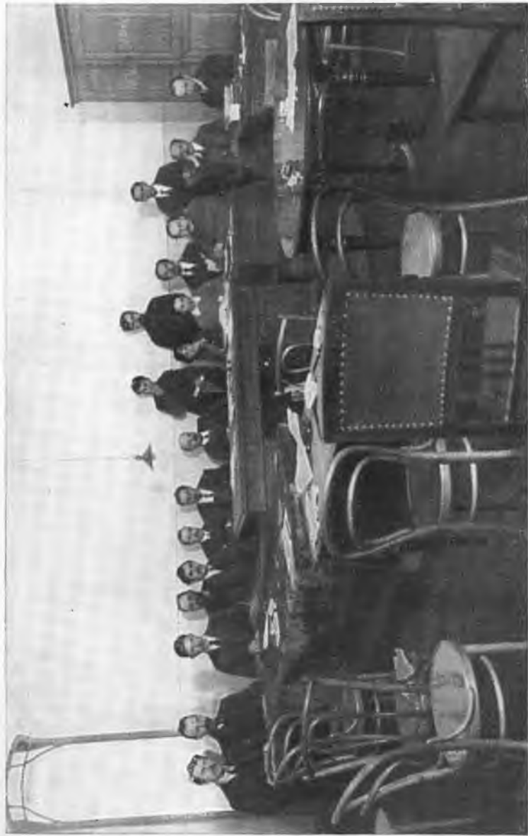
Заседание Совета Народных Комиссаров с участием В. И. Ленина. Петроград, 1918 г.