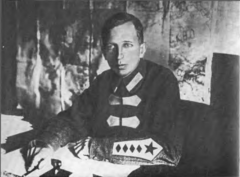
А. С. Бубнов — начальник ПУРа в рабочем кабинете. 1924 г.