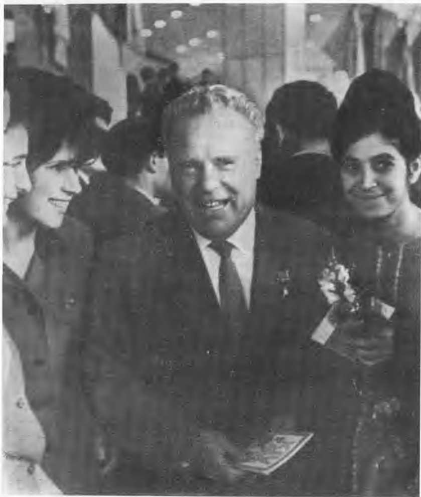
А. И. Шахурин среди делегатов XV съезда ВЛКСМ. 1966 г.