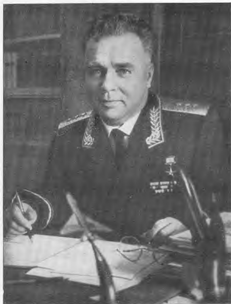
А. И. Шахурин в последние годы жизни.