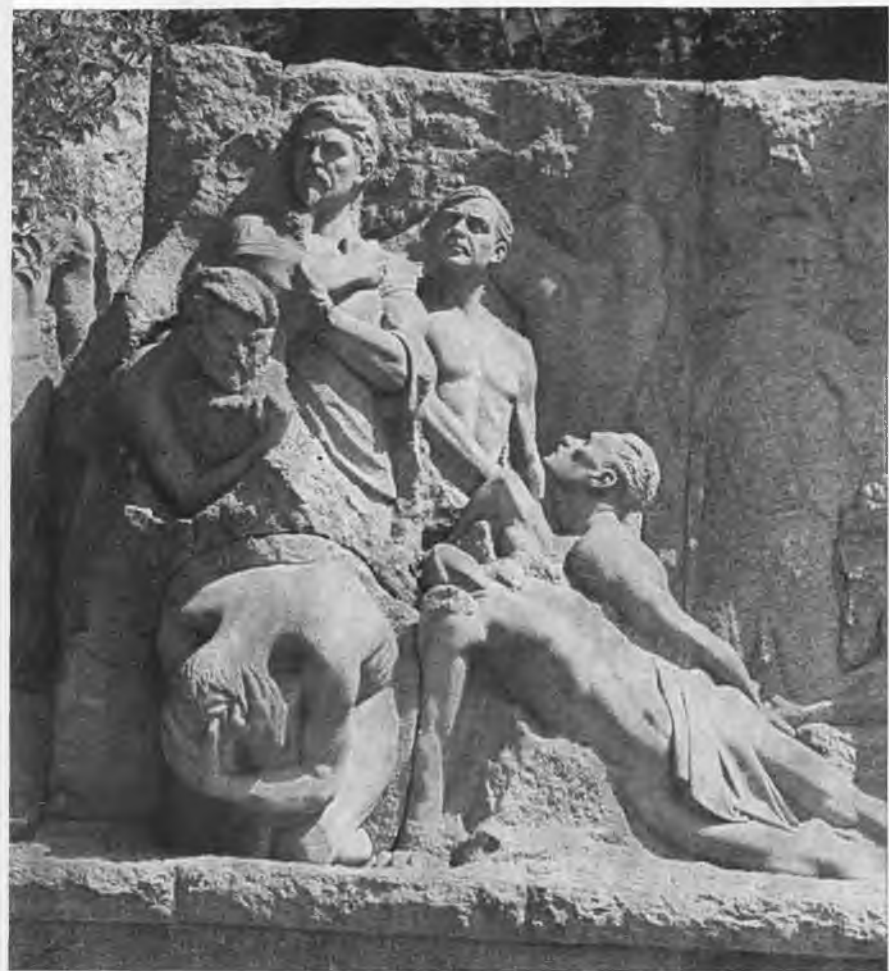
Горельеф, посвященный бакинским комиссарам, в г. Баку.