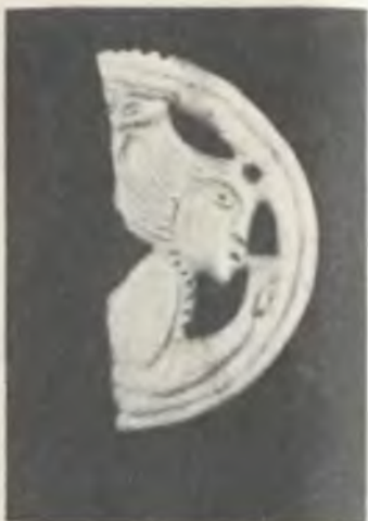
Участница русалии, пьющая вино из рога. Деталь костяной накладки XII в.