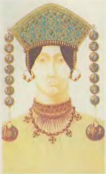
Головной убор замужней женщины Реконструкция Б. А. Рыбакова