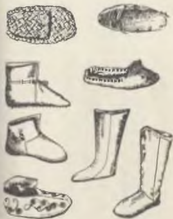
Обувь X—XIII вв. (по материалам раскопок): лапоть, поршни, чоботы, сапоги