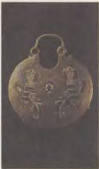
Колт с изображением сиринов-птиц-дев, которые, согласно поверью, приносили радость материнства и семейного счастья.