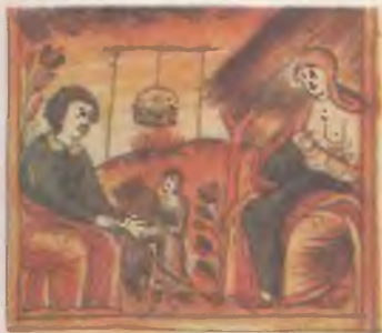
Крестьянская семья. Миниатюра «Синодика Вологодской церкви» XVII в.