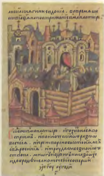
Изображение вдовки Дмитриевны, вдовы в. кн. Дмитрия Ивановича Донского, в Лицевом своде XVI в.