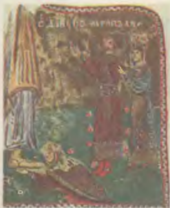
Кн. Олисава-Гертруда и ее сын Ярополк. Миниатюра Трирской псалтыри. Конец XI в.