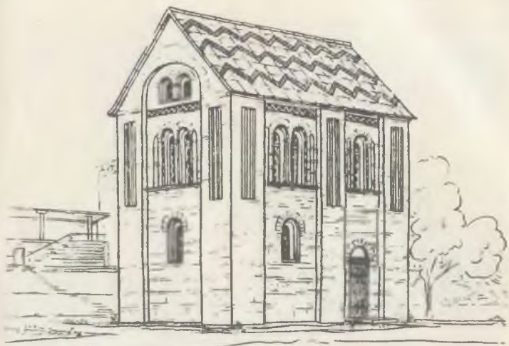
Усадьба зажиточных горожан в Нов городской земле XII в. Реконструк- ция В. Л. Янина