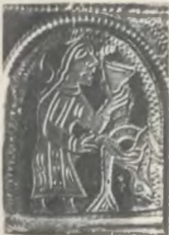
Изображение женщины, пьющей вино из чарки, на серебряном браслете XII в.