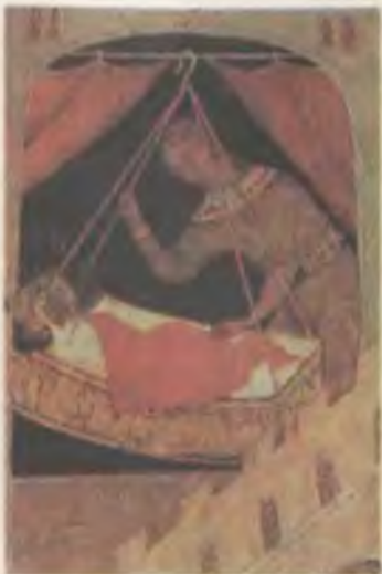
Девушка-служанка у колыбели младенца. Деталь иконы XVI в.