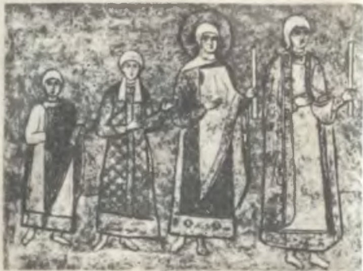
Анна, дочь в. кн. Ярослава Муд- рого, жена Генриха I, королева Франции. XI в.