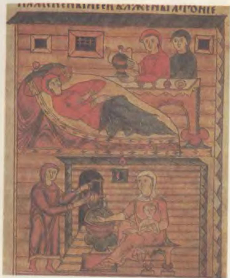
Роды и восприятие ребенка. Миниатюра житийной повести об Антонии Сийском XVII в.