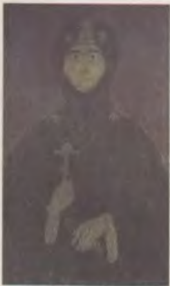
Евфросинья суздальская. Деталь Покрова XVI в.