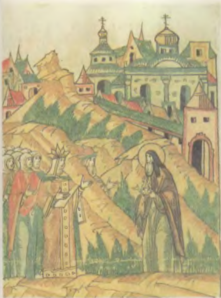
Приезд в кн. Софьи Витовтовны в Троице-Сергиев монастырь. Миниатюра Лицевого свода XVI в.