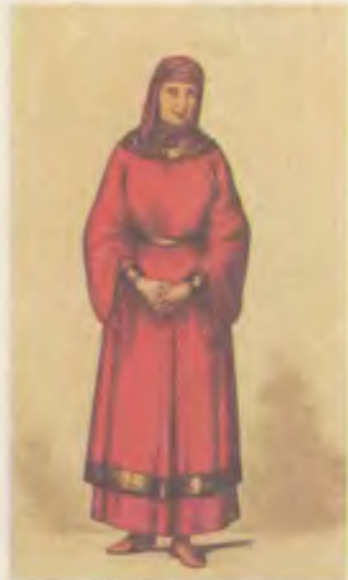
3 — княгиня в XII в.,