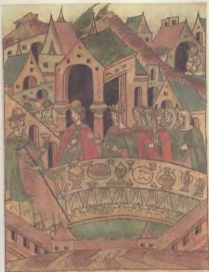
Свадебный пир Ивана Младого и Елены Волошанки. Миниатюра Лицевого свода XVI в.

БРАТСТВО ПЕРНИКАГО И ИВАНА МЛАДОГО ТО ИЖЕ ЗИМЫ ПЕРНИКАГО, ОИ ДЕНЬ ЖЕННА СЯ И СЪ ПЕРНИКИ И ИВАНОМ.