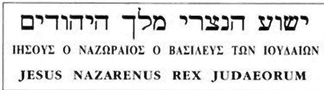
Надпись на кресте

Никого из близких не было рядом с Христом. Он шел в окружении угрюмых солдат, два преступника, вероятно, сообщники Вараввы, делили с Ним путь к месту казни. Каждый имел titulum , табличку с указанием его вины. Та, что висела на груди Христа, была написана на трех языках: еврейском, греческом и латинском, чтобы все могли прочесть ее. Она гласила: "Иисус Назарянин, Царь Иудейский" [2] .