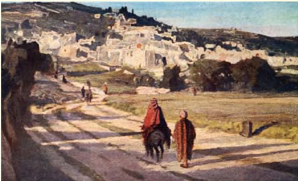
Возвратились в Назарет

Впрочем, сам Назарет стоял в стороне от этих больших исторических дорог, в евангельскую эпоху он считался захолустным селением. Сложилась даже поговорка: “Может ли быть что доброе из Назарета?” И словно для того, чтобы опровергнуть все человеческие оценки, именно этот бедный поселок стал “отечеством” Христа; в нем прошла большая часть Его жизни. Почти 30 лет Он ходил по его каменистым улицам и поднимался тропинками на окрестные холмы. Немногие знали о действительном месте Его рождения, но даже те, кто слышал об этом, называли Его Ханоцри, Назарянином.