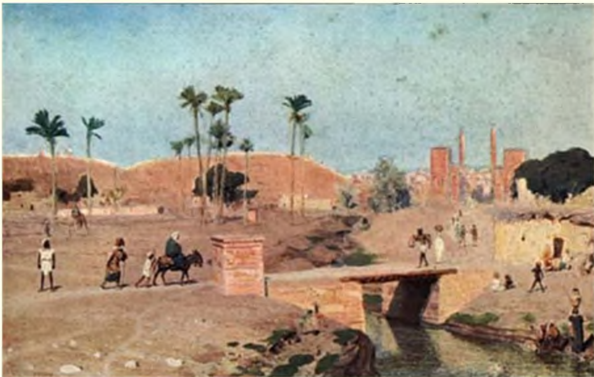
Пошел в Египет

В какой степени приказ был выполнен, неизвестно. Ирод несомненно давал его в глубокой тайне. Даже Иосиф Флавий, писавший о тех временах, не упоминает о Вифлеемской трагедии. Впрочем, в его глазах она была слишком незначительной в сравнении с бесчисленными зверствами Ирода.