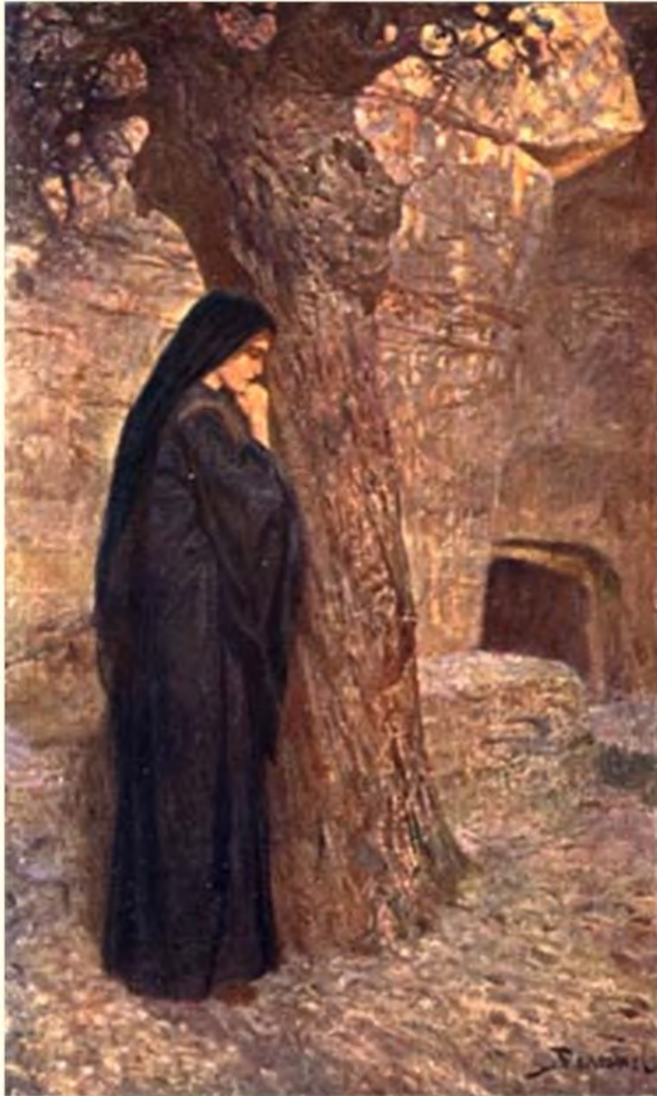
Стояла у гроба

Мария Магдалина и Мария Иаковлева тоже присутствовали в саду при погребении. Они стояли