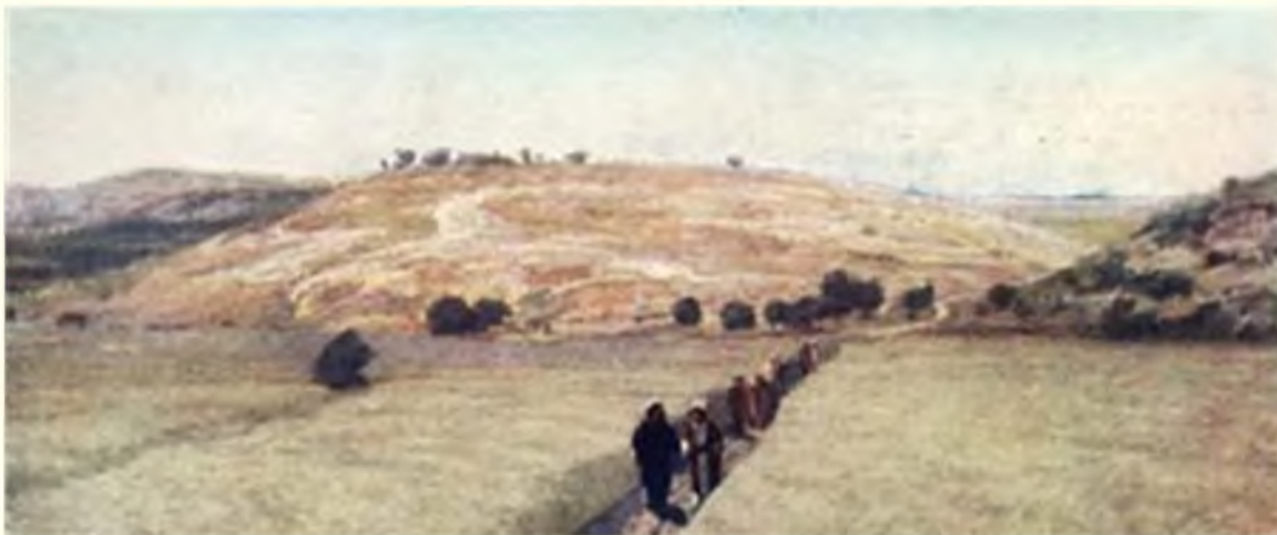
По засеянным полям

Иисус называл свои чудеса "знамениями", признаками наступления иной эпохи. Совершенный Человек, Он одолевает законы падшего мира, указывает путь борьбы с нравственным и физическим несовершенством.