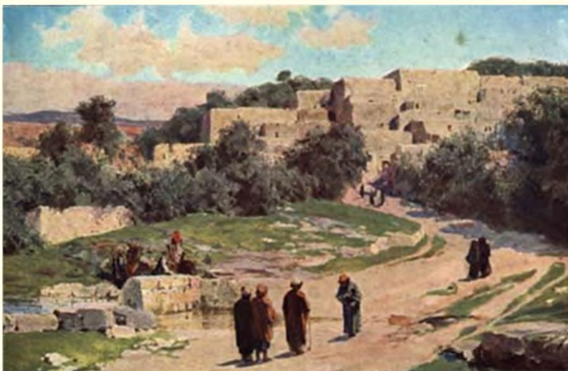
В Кане Галилейской

Так проявление власти Христа над природой началось не устрашающими знаменами, а за праздничным столом, под звуки свадебных песен. Он употребил ее, чтобы не омрачился день веселия, как бы невзначай. Ведь Он пришел дать людям радость, полноту и “избыток” жизни [13] .