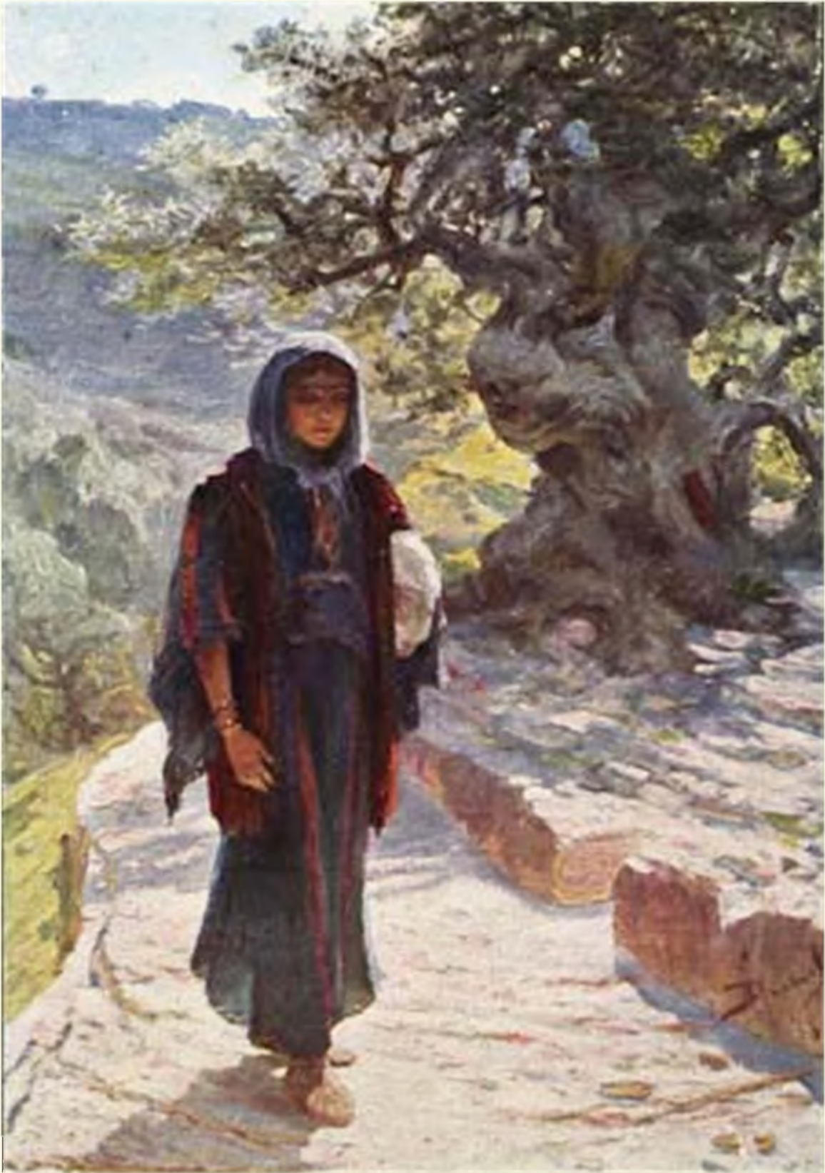
Пошла в нагорную страну