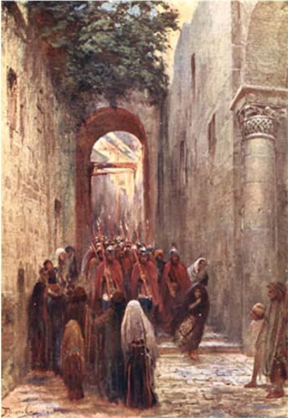
Повели на казнь