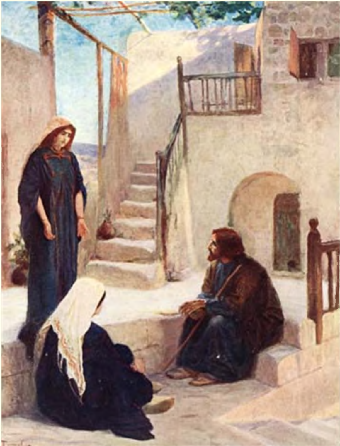
У Марии и Марфы

Евангелие разрушило преграды, издавна разделявшие людей. Тем, кто соблюдал обряды Закона и кто не знал их, иудеям и чужеземцам, мужчинам и