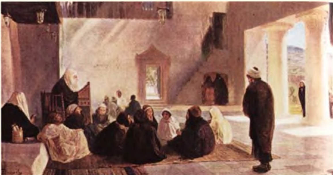
Нашли в храме посреди учителей

Казалось, внезапно Он стал далеким и загадочным, и Его слова вызвали у родителей замешательство. Они не поняли, что Он имеет в виду. Однако Иисус тут же поднялся и последовал за ними. Единственный раз неземной луч сверкнул из-за облака и скрылся. Он снова - обыкновенное Дитя, подобное прочим детям.