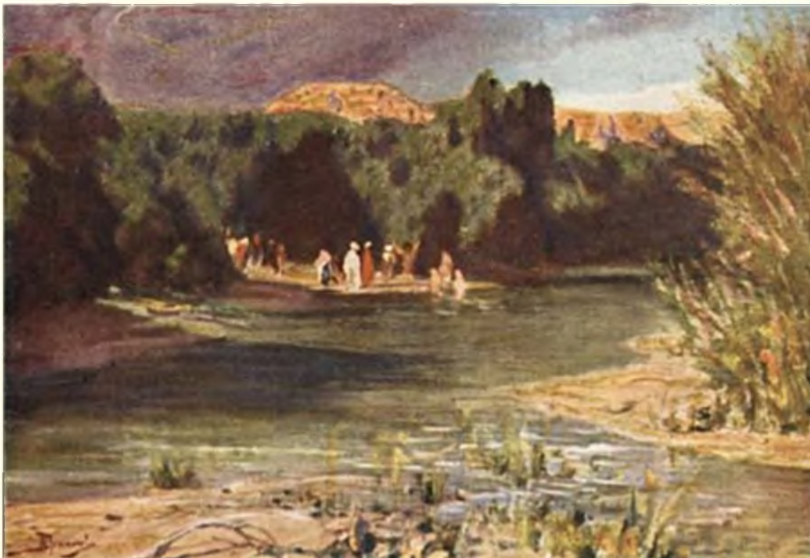
Крестились от него

Чего же хотел Иоанн? Призывал ли он народ бежать от мира и запереться в монастырских стенах? Это звучало бы вполне естественно в устах аскета. Но Креститель хотел большего: чтобы люди, оставаясь там, где живут, сохраняли верность слову Божию.