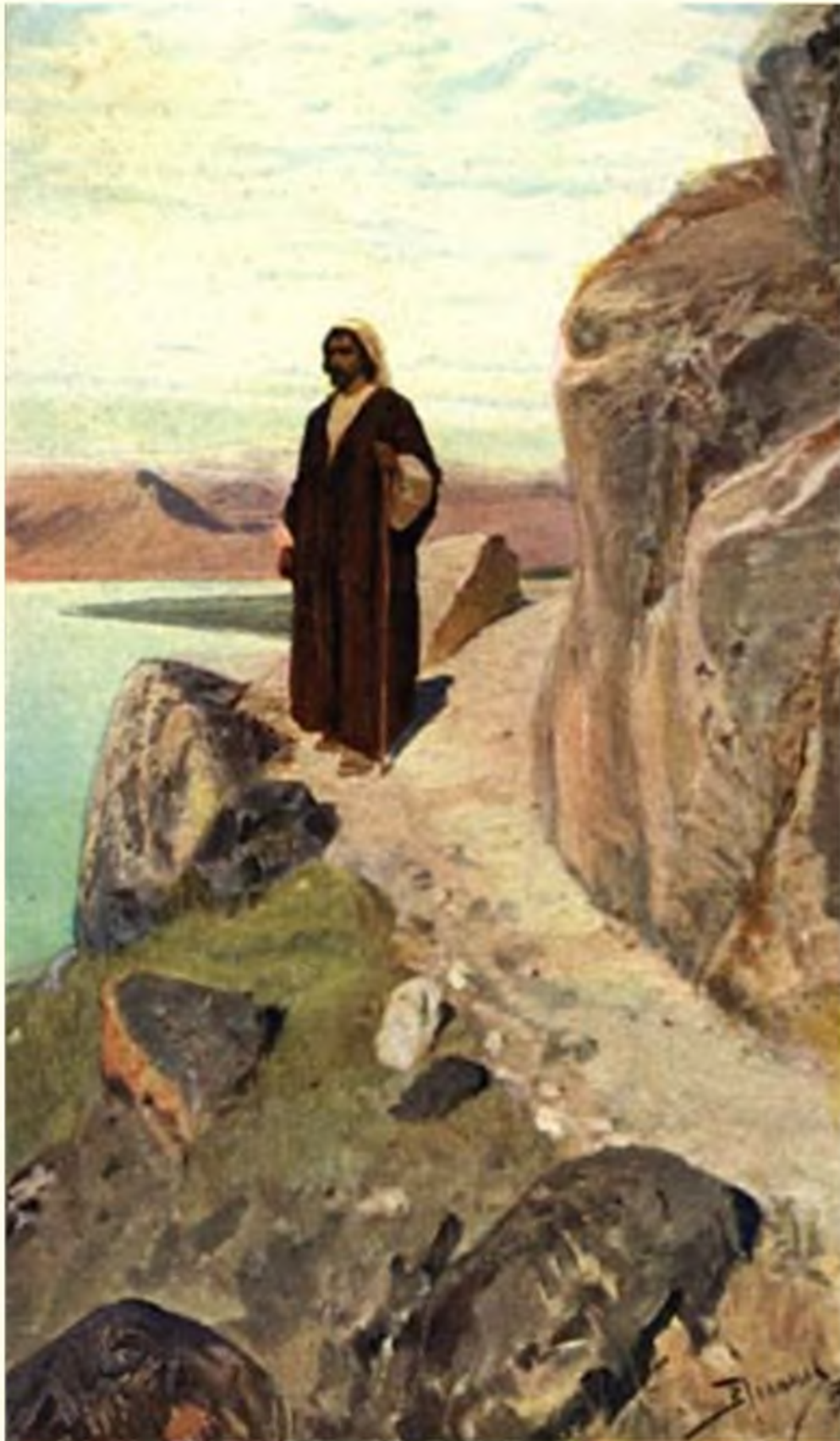
Возвратился в Галилею в силе Духа