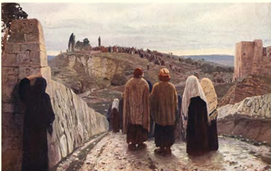
Вошли на Голгофу

Выйдя из города, повернули к крутому главному холму, расположенному недалеко от стен, у дороги. За свою форму он получил название Голгофа - "Череп", или "Лобное место" [4] . На его вершине должны были поставить кресты. Римляне всегда распинали осужденных вдоль людных путей, чтобы их видом устрашать непокорных.