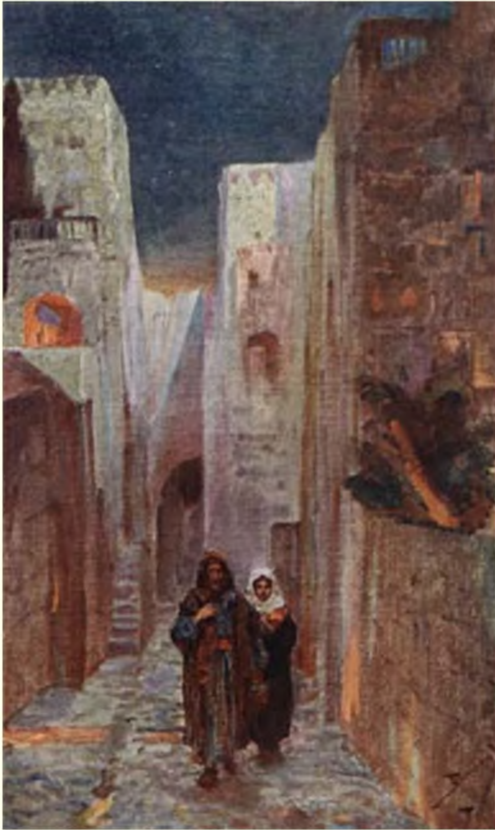
Иосиф ночью взял младенца и мать.