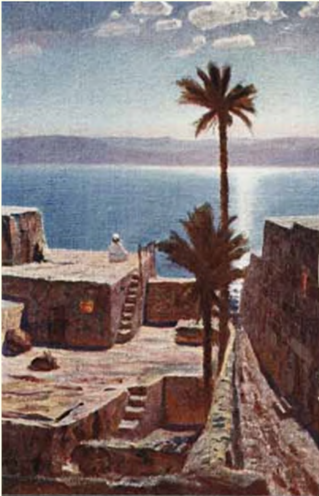
Поселился в Капернауме приморском