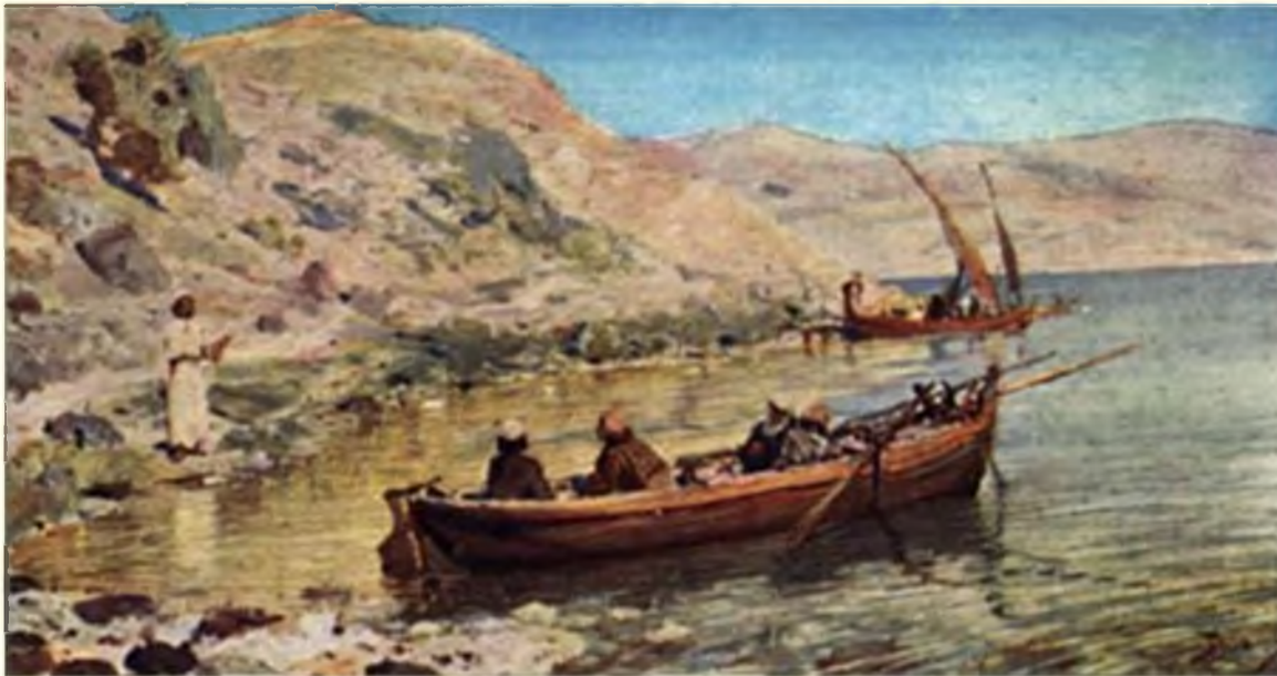
Иаков и Иоанн

Своих врагов. Иоанн и Иаков втайне мечтали занять первые места у трона Христова. Иисус называл обоих братьев Бенегерес, “сынами грозы” [15] . Пылкий Иоанн стал Его любимым учеником.