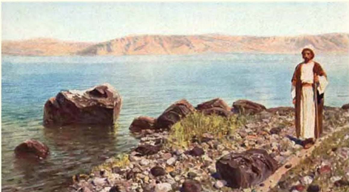
У моря Галилейского

Притчи издавна были известны в Израиле, но Иисус сделал их основным способом выражения Своих мыслей. Он обращался не к одному интеллекту, а стремился затронуть все существо человека. Рисуя перед людьми знакомые картины природы и быта, Христос нередко предоставлял самим слушателям делать выводы из Его рассказов. Так, избегая абстрактных слов о человеческом братстве, Он приводит случай на иерихонской дороге, когда пострадавший от разбойников иудей получил помощь от иноверца-самарянина. Подобные истории западали в душу и оказывались действеннее любых рассуждений.