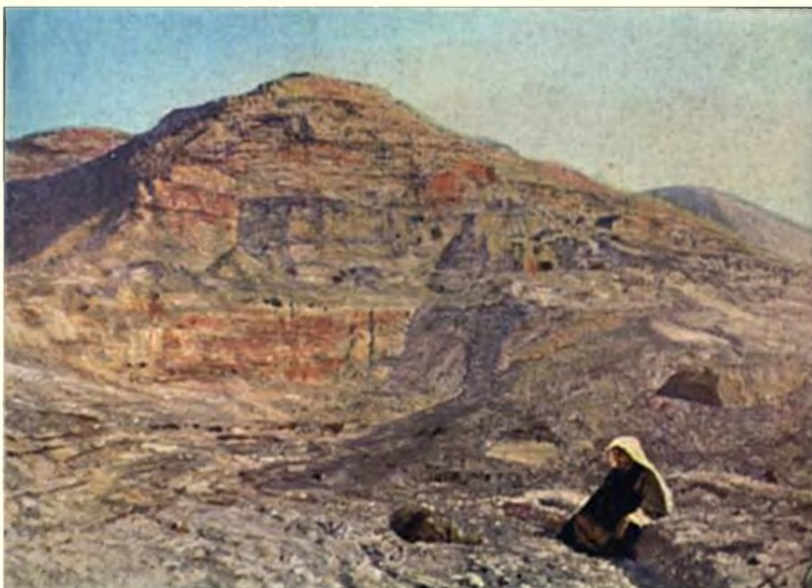
Был в пустыне со зверями

Приход Его едва ли привлек внимание, тем более что Он вместе с другими готовился принять крещение от Иоанна. Однако, когда Он подошел к воде, всех поразили странные слова пророка, обращенные к Галилеянину: “Мне надо креститься от Тебя”.