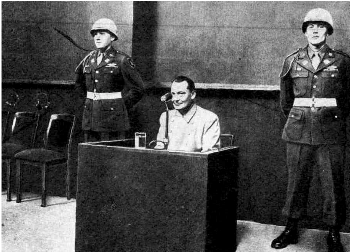
Допрос подсудимого Геринга.