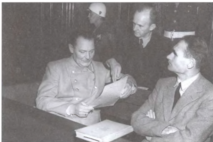
Герман Геринг, Карл Дённиц и Рудольф Гесс на скамье подсудимых Нюрнбергского трибунала