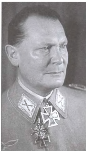
Рейхсминистр Имперского министерства авиации, рейхсмаршал Герман Геринг