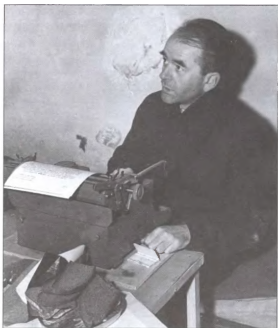
Альберт Шпеер в Нюрнбергской тюрьме