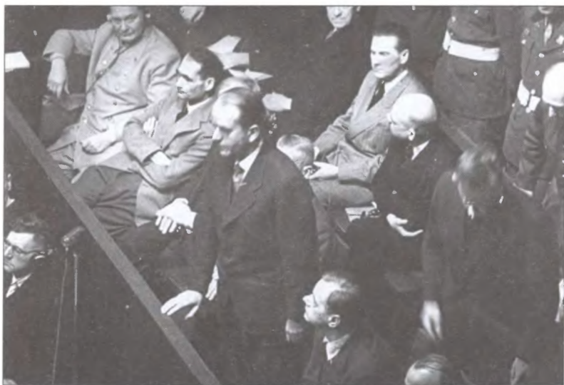
Альберт Шпеер дает показания на Нюрнбергском трибунале