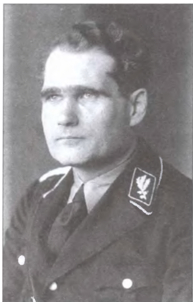
Заместитель Гитлера по партии, рейхсминистр без портфеля, рейхсляйтер Рудольф Гесс