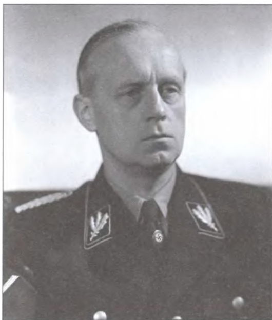
Министр иностранных дел Германии Йоахим фон Риббентроп