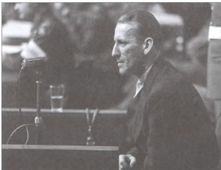
Эрнст Кальтенбруннер отвечает на вопросы судьи