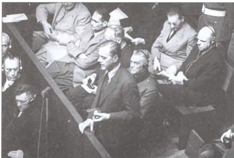
Альфред Розенберг дает показания на Нюрнбергском трибунале