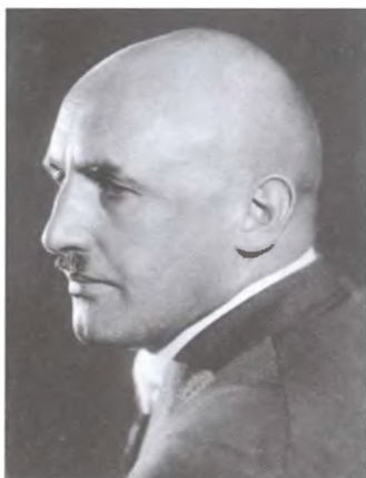
Гауляйтер Франконии Юлиус Штрайхер