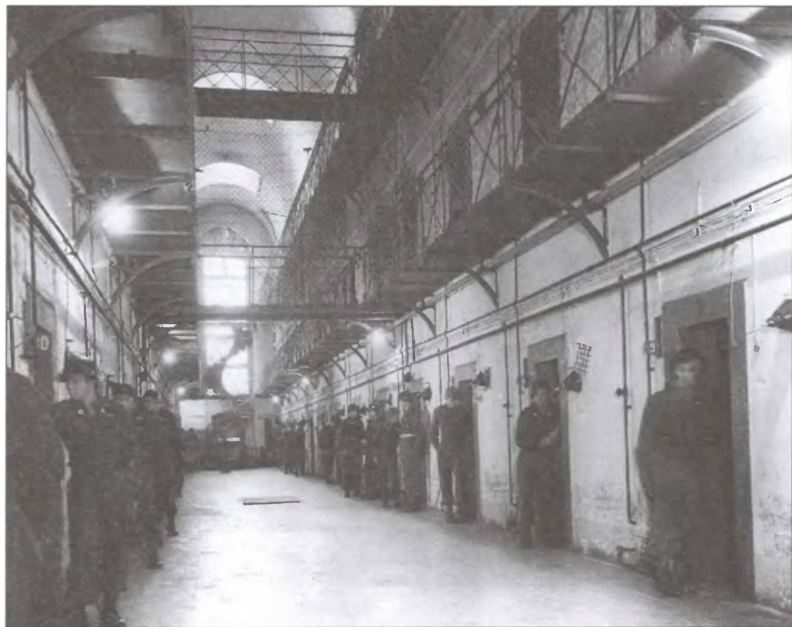
Внутренний зал тюрьмы