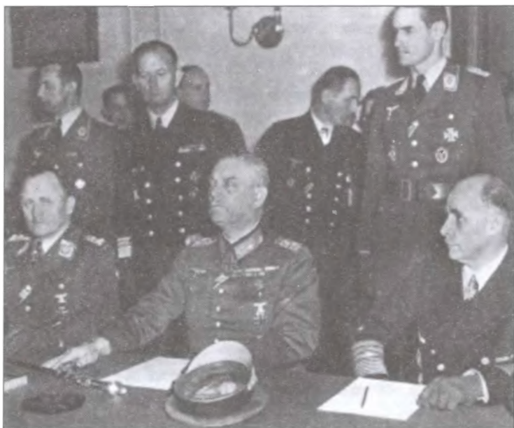
Фельдмаршал Вильгельм Кейтель во время подписания акта о безоговорочной капитуляции Германии