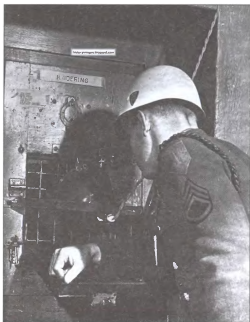
Охранник заглядывает в камеру Геринга