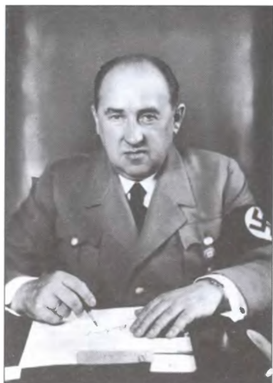
Министр экономики в Третьем рейхе, президент Рейхсбанка Вальтер Функ