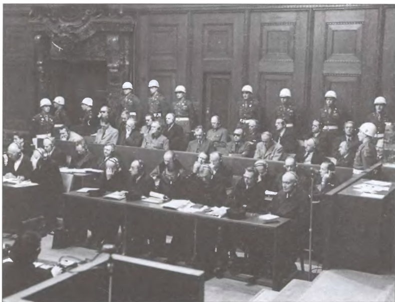
Главные военные преступники на скамье подсудимых во время заседания Нюрнбергского трибунала