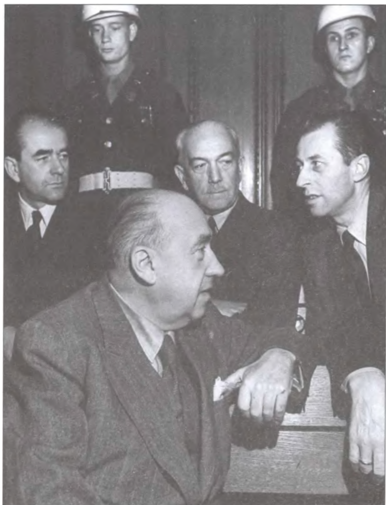
На заседанији Нјурнберског трибунала (слева направо): Константин Нејрат, Вальтер Функ, Альберт Шпеер и Ганс Фриче