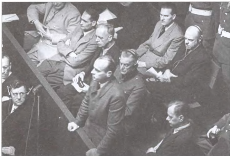
Ганс Франк дает показания на Нюрнбергском трибунале