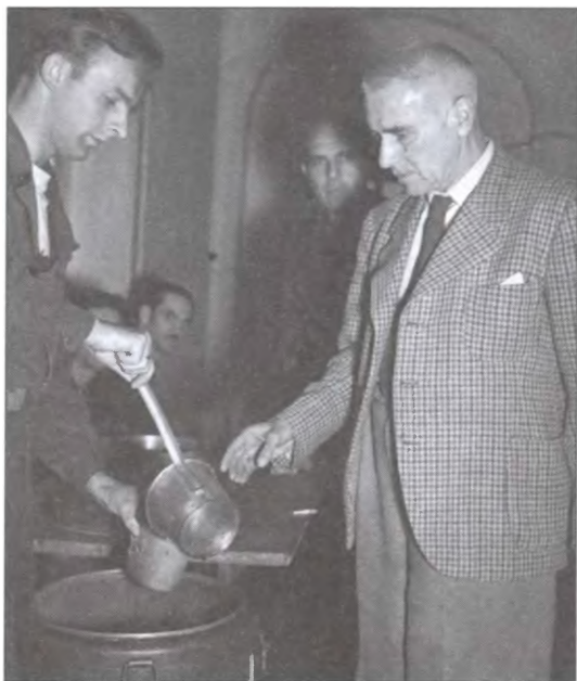
Вильгельм Фрик получает тюремный обед