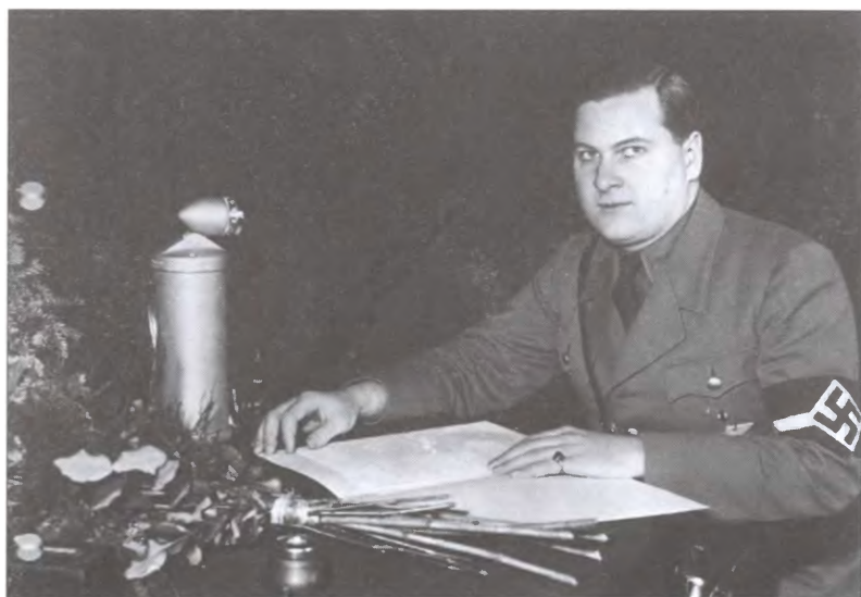
Рейхсжюгендфюрер, позже — гауляйтер Вены Бальдур фон Ширах