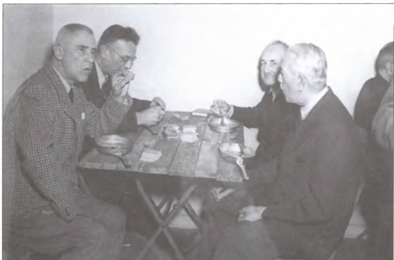
Вильгельм Фрик, Артур Зейсс-Инкварт, Юлиус Штрайхер, Константин фон Нейрат за тюремной трапезой