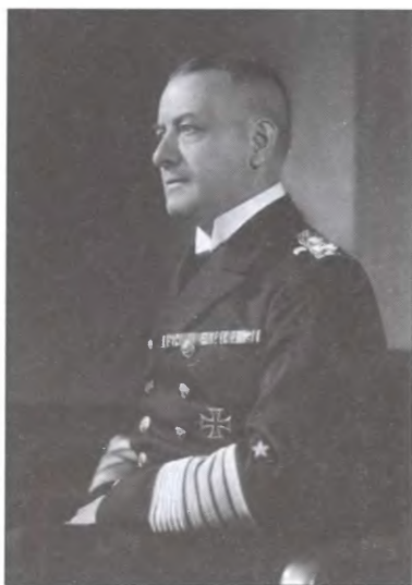
Главнокомандующий кригсмарине гросс-адмирал Эрих Редер