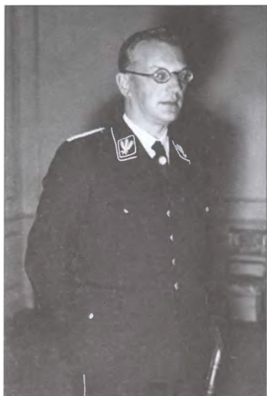
Рейхскомиссар Нидерландов Артур Зейсс-Инкварт