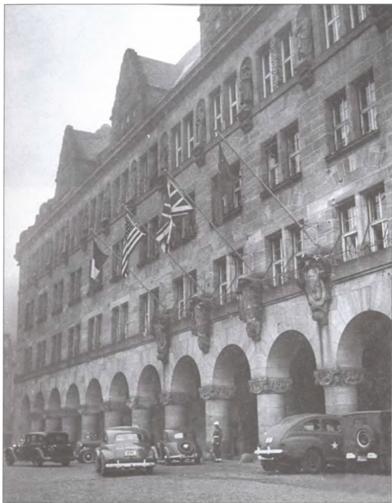
Здание, в котором проходили заседания Нюрнбергского трибунала