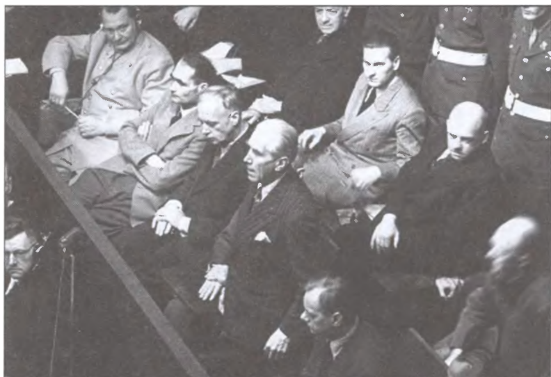
Франц Папен дает показания на Нюрнбергском трибунале