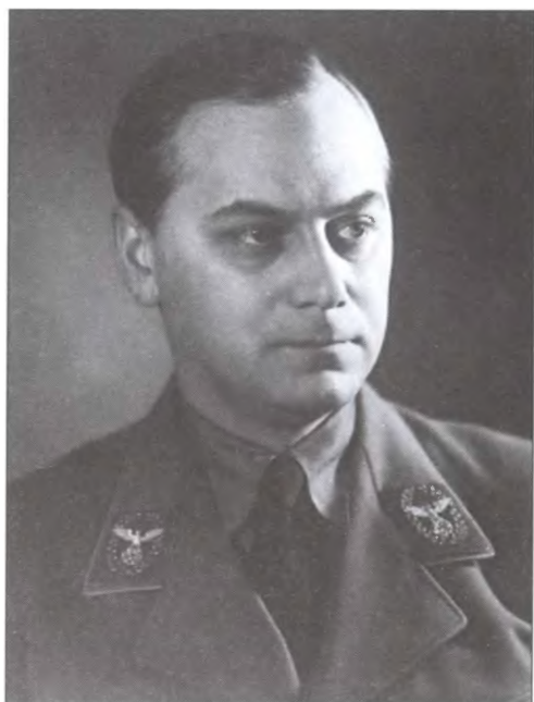
Главный идеолог НСДАП Альфред Розенберг