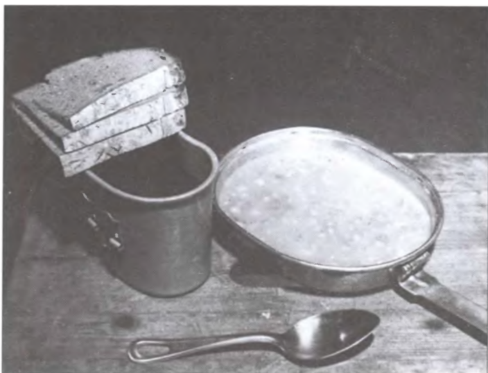
Обеденный рацион для заключенных Нюрнбергской тюрьмы