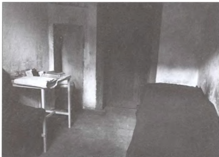
Камера для подсудимых