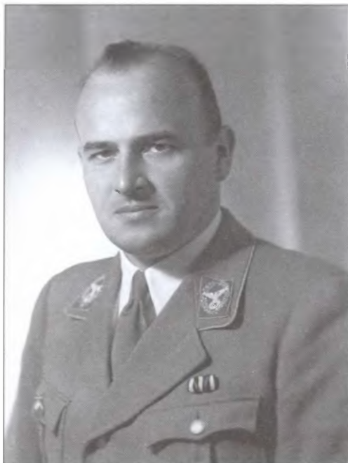
Генерал-губернатор оккупированной Польши Ганс Франк