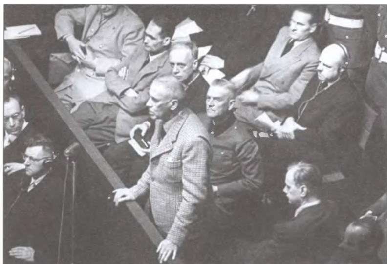
Вильгельм Фрик дает показания на Нюрнбергском трибунале