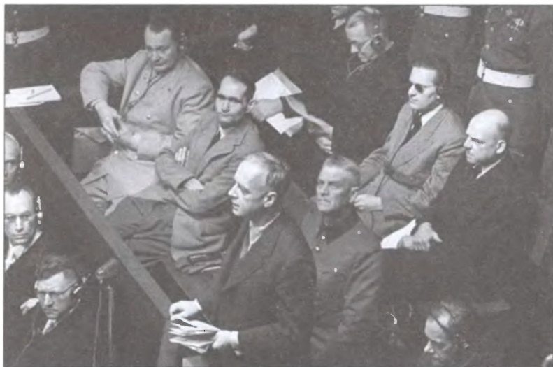
Йоахим фон Риббентроп дает показания на Нюрнбергском трибунале