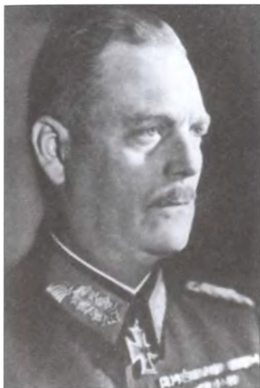
Начальник штаба Верховного главнокомандования вооруженными силами Германии фельдмаршал Вильгельм Кейтель