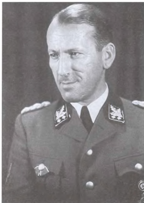
Начальник Главного управления имперской безопасности СС Эрнст Кальтенбруннер