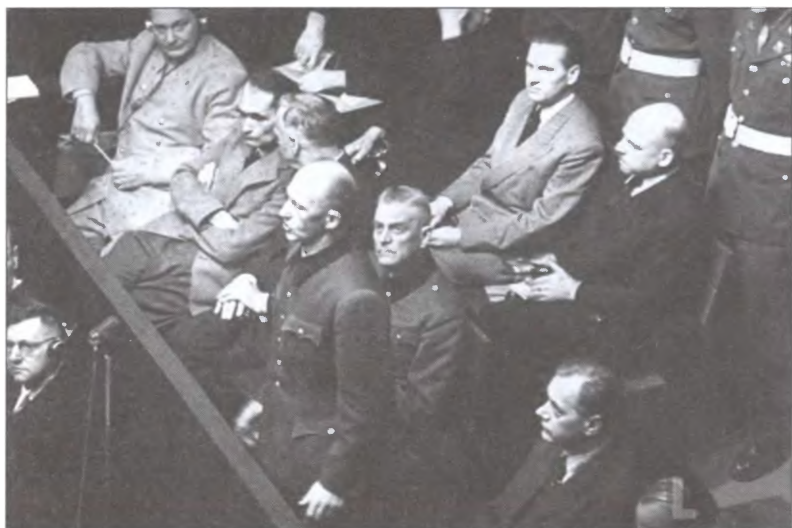
Альфред Йодль дает показания на Нюрнбергском трибунале