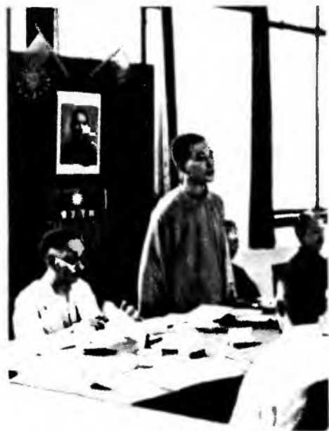
Ван Цзинвэй призывает к сотрудничеству с Японией