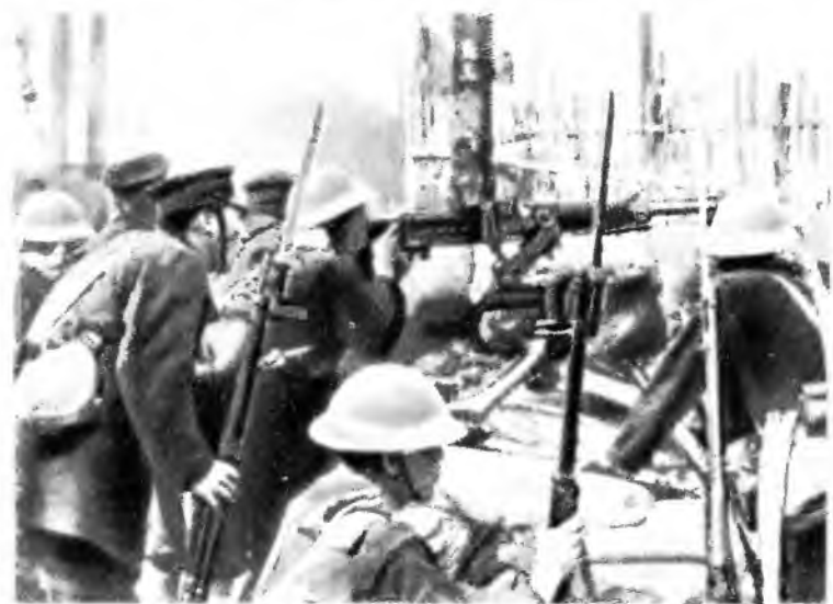
Вторжение японских милитаристов в Маньчжурию. 1931 г.