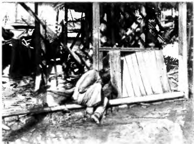
Ханькоу после японской бомбардировки. 1938 г.