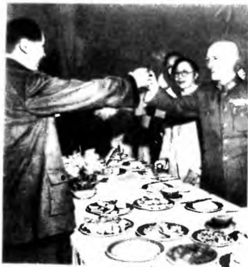
Чан Кайши и Мао Цзэдун. Тост в честь переговоров в Чунцине. 1945 г.