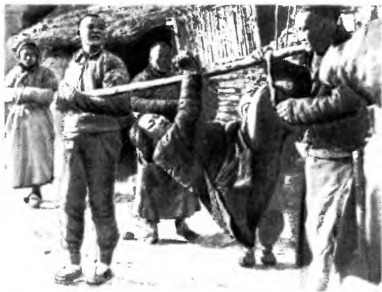
Террор — орудие устрашения: голова казненных революционеров