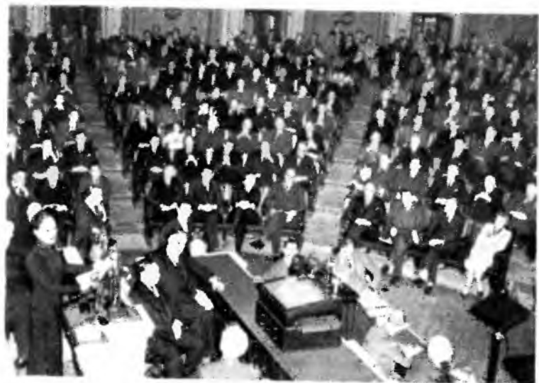
Генералиссимус инспектирует войска