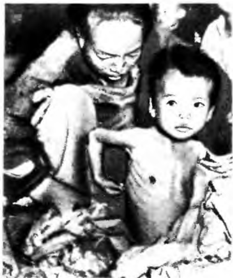
Жертвы голода. 1943 г.