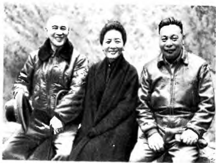
В кругу семьи. 1959 г.