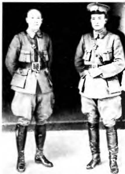
Чан Кайши (слева) в дни переворота 1927 г.