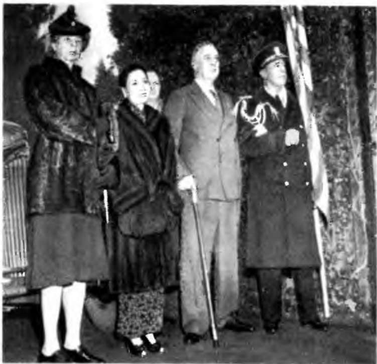
Сун Мэйлин с четой Рузвельтов