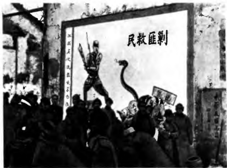
Гоминьдан сражается с врагами