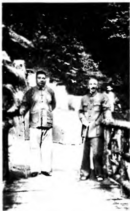
Чан Кайши и Фэн Юйсян — соратники и соперники