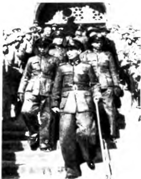
Чан Кайши у мемориала Сунь Ятсена