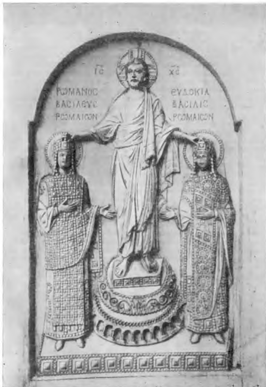
Роман (предположительно — Роман IV) и Евдокия Слоновая кость. Ок. 950 г. Париж Кабинет Медалей