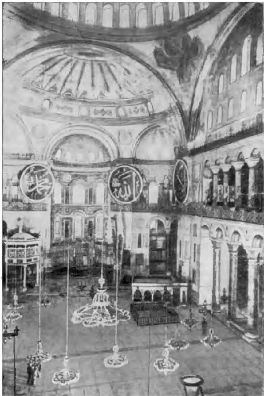
Храм св. Софии. Внутренний вид