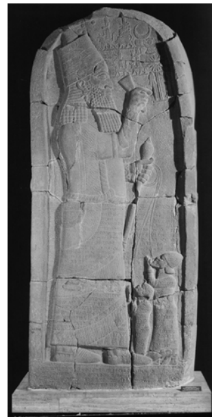
Стела з асирійським царем Асаргаддоном. VII до н.е.

На час організації постачання грецького вина у Північне Причорномор'я скіфи уже повернулися з Передньої Азії, де воювали упродовж двох століть. Там вони були свідками ритуального споживання вина царями. До нашого часу уціліли монументальні зображення союзників скіфів асирійських царів Асаргаддона (680–669 до н.е.) 18 та Ашшурбаніпала (668–627 до н.е.) 19 в моменти їхніх тріумфів – із келихом чи ритонном в руках. Вміст царського келиха не викликає сумніву, оскільки в сцені тріумфу Ашшурбаніпала він з царицею зображений під виноградними лозами. Обидва ж зображення демонструють перемоги царів: Асаргаддон замовив на зображенні постаті сирійського царя та єгипетського фараона, яких він тримав за мотузки, прив'язані за їхні шиї, а Ашшурбаніпал бенкетував у саду, де на одному з дерев була почеплена голова переможеного еламського царя. Отже, вино тут постає як напій безсмертя і гідності.