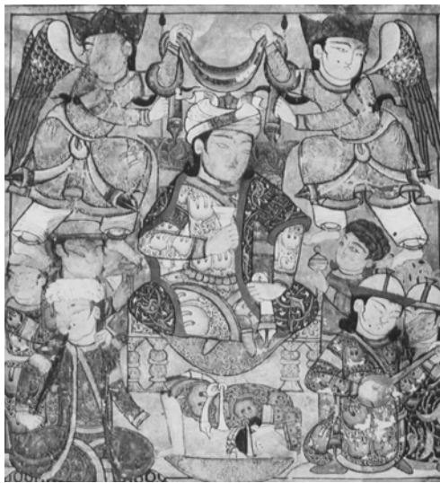
Мініатюра з мусульманським правителем. Єгипет, XIV ст.

Політичний вплив передбачав як мінімум тимчасову присутність степових військових та адміністраторів на підконтрольній території, обмін посольствами та інші персональні контакти між степовиками та осідлим населенням. Це створило передумови для запозичення степових звичаїв на селенням підконтрольних територій.