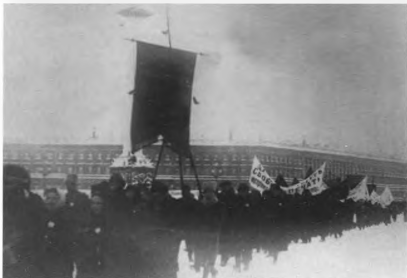
Демонстрация в защиту Учредительного собрания. Петроград. Январь 1918 г.