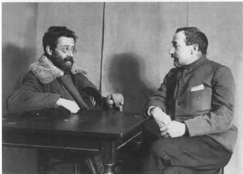
Ф.И.Дан и Ю.О.Мартов.