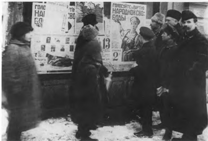
Плакаты на улицах Петрограда по случаю выборов.

Предвыборные листовки конституционно-демократической партии