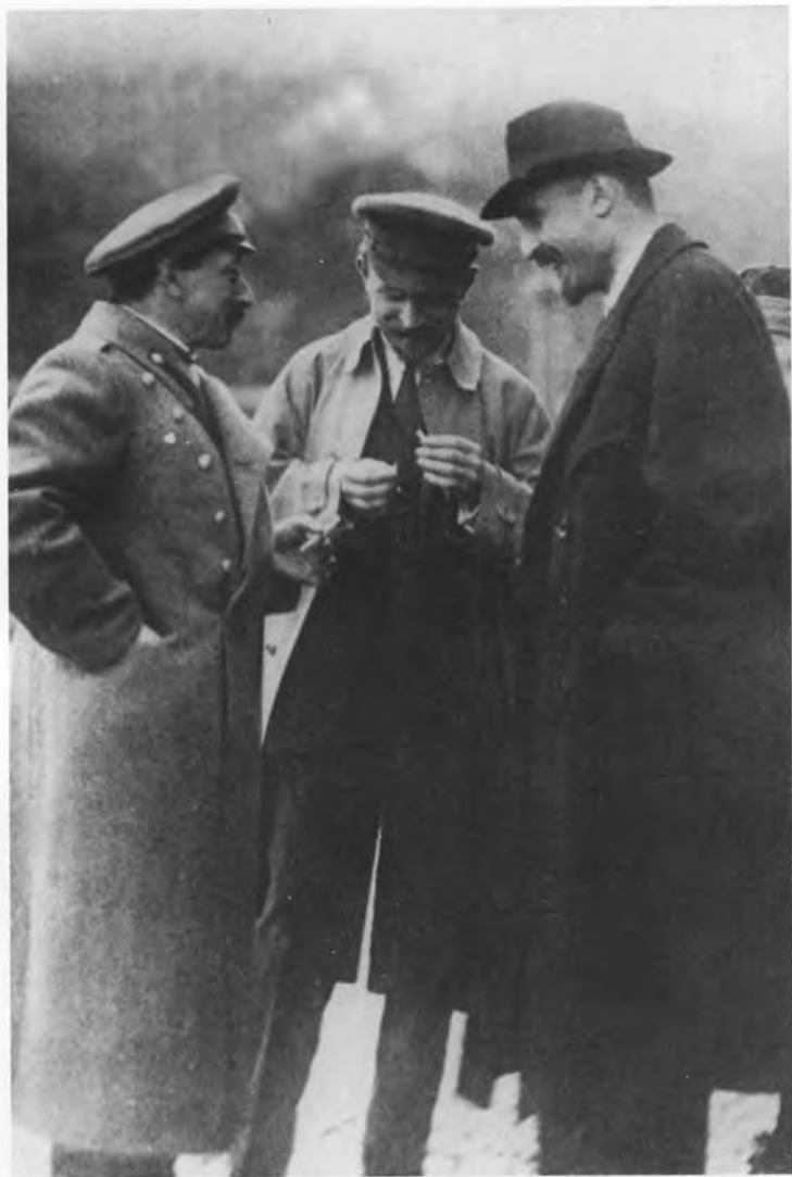
Меньшевики Ф.И.Дан, М.И.Скобелев, И.Г.Церетели.