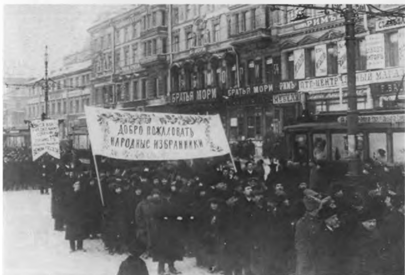
Демонстрация в день открытия Учредительного собрания. Петроград. 5 января 1918 г.