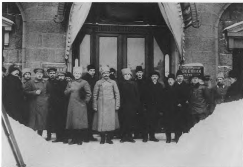
Группа левых эсеров — делегатов в Учредительное собрание от Украины у здания Петроградской военной гостиницы.

Готовьтесь к учредительному собранию. Народ едва имеет понятие о немъ. Надо выбрать достойныхъ депутатовъ и давать имъ наказъ — земли, воли и др. законы. Катерина Брешковская Самара, 18 марта 1917 г.