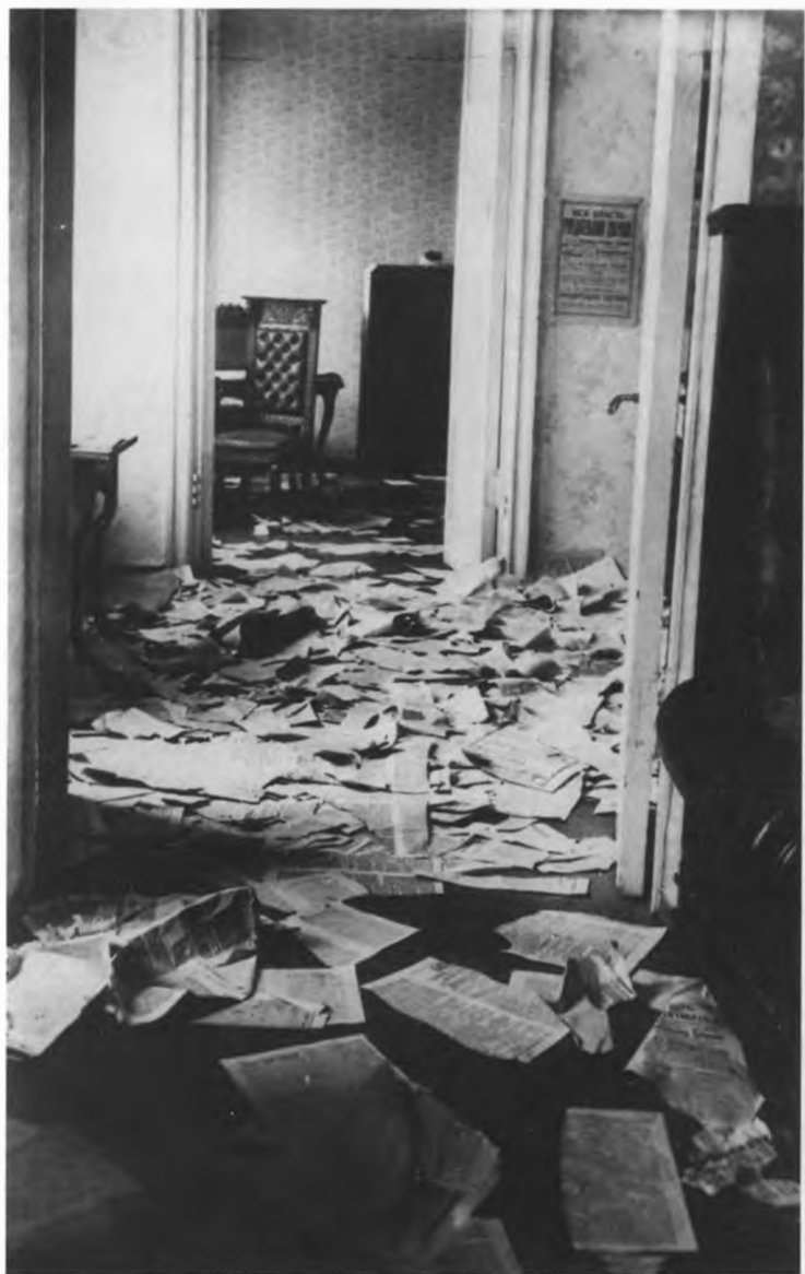
Вид помещения в Таврическом дворце после разгона Учредительного собрания.