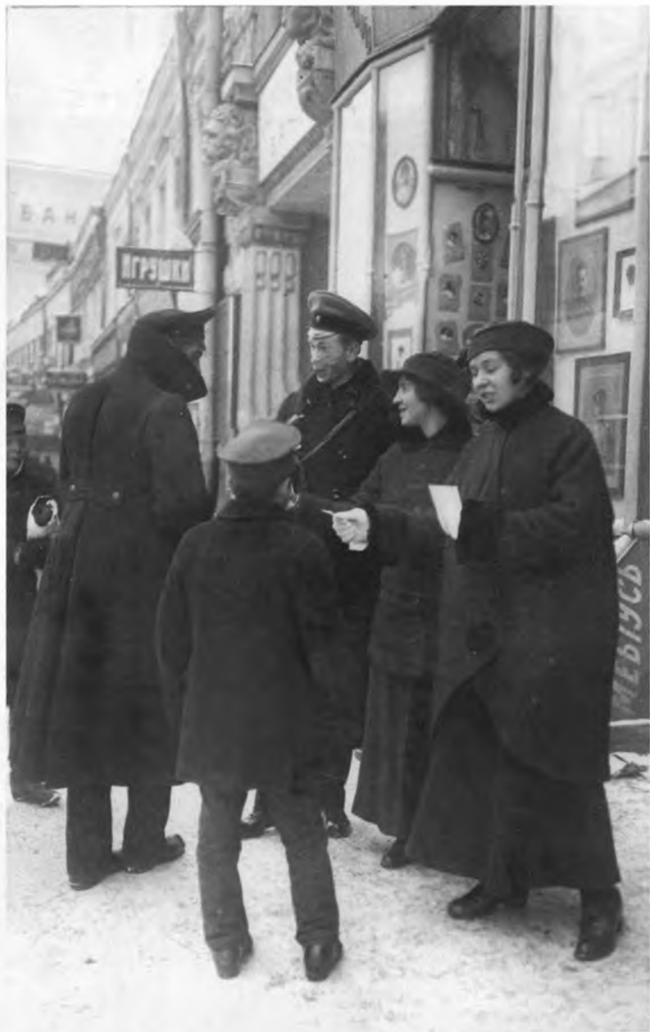
Агитация на улицах Москвы во время выборов в Учредительное собрание.