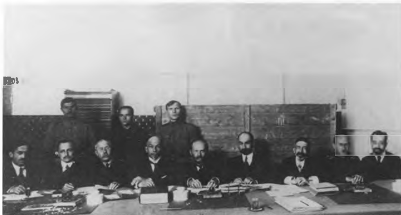
Всевыборы под председательством М.М.Винавера.