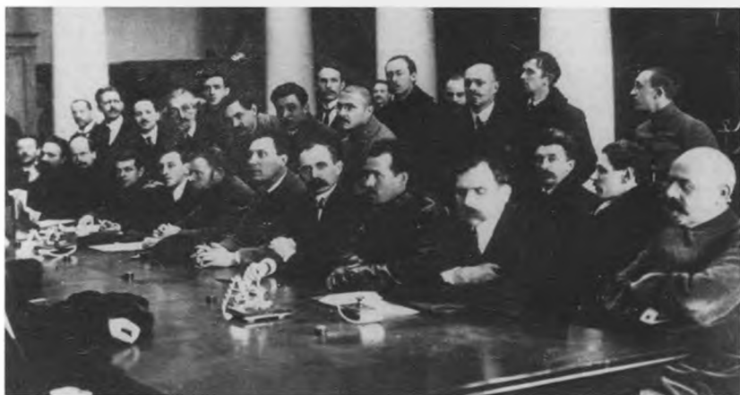
Заседание правых эсеров в библиотеке Таврического дворца.