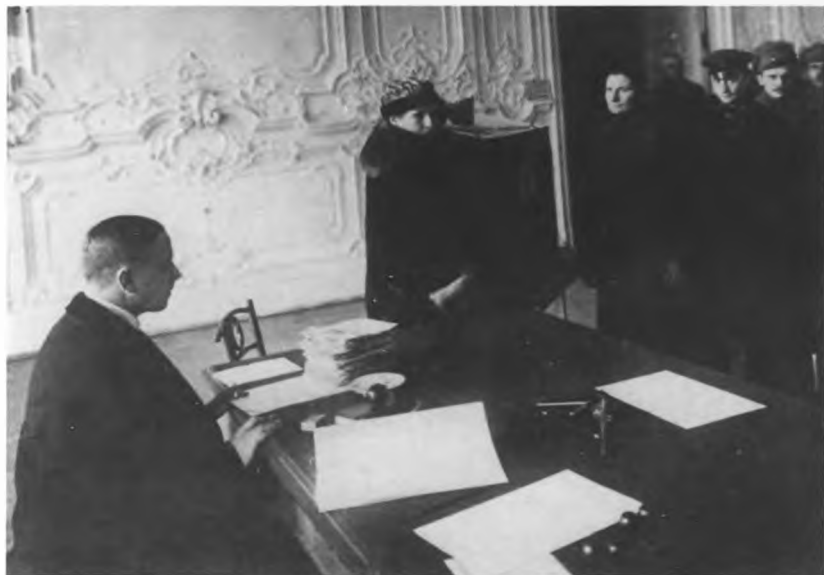
В районной избирательной комиссии по выборам в Учредительное собрание. Петроград.