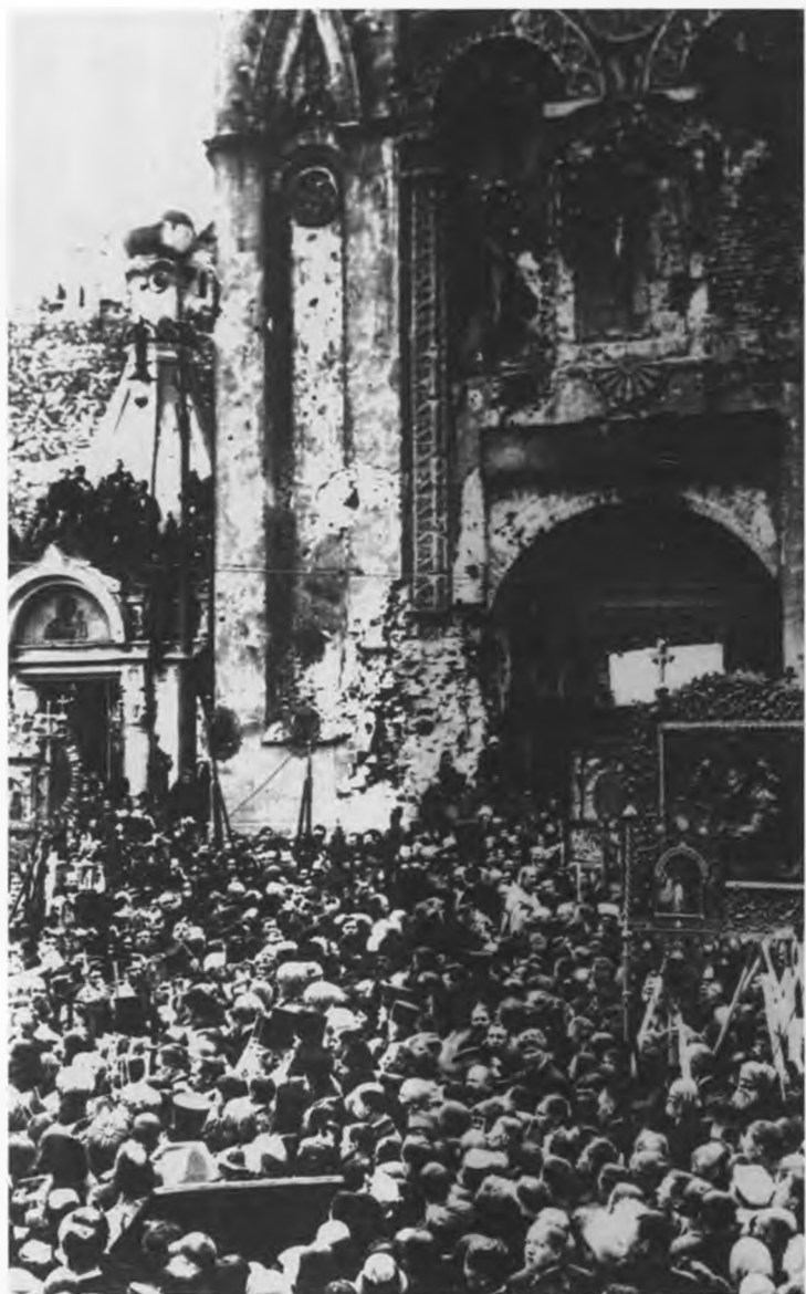
Молебен у Никольских ворот на Красной площади в знак протеста против разгона Учредительного собрания.