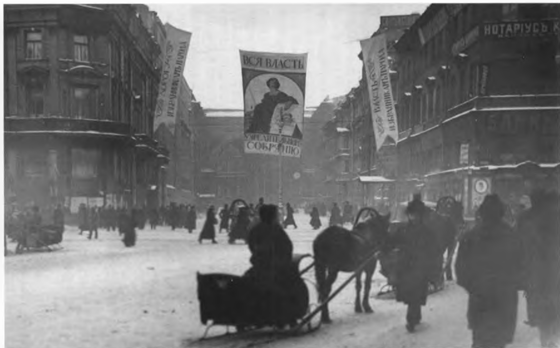
Плакаты на Невском проспекте накануне выборов в Учредительное собрание. Ноябрь 1917 г.