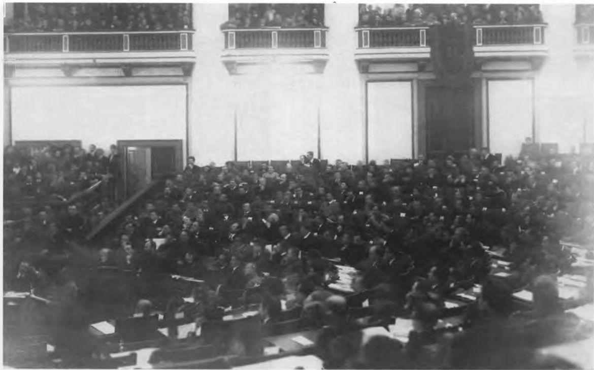
Вид заседания Учредительного собрания.