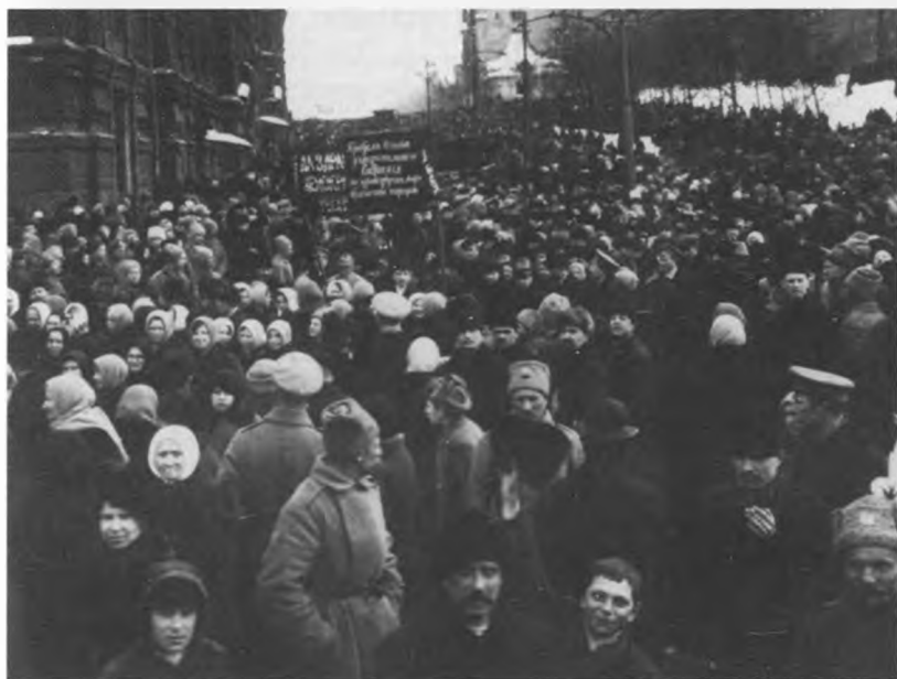
Демонстранты с плакатами о созыве Учредительного собрания на Красной площади.