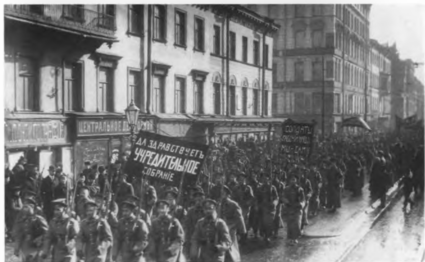
Манифестация юнкеров Владимирского военного училища на Литейном проспекте.