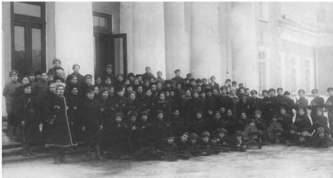
Охрана Таврического дворца (А.Г.Железняков и М.С.Урицкий). 5 января 1918 г.