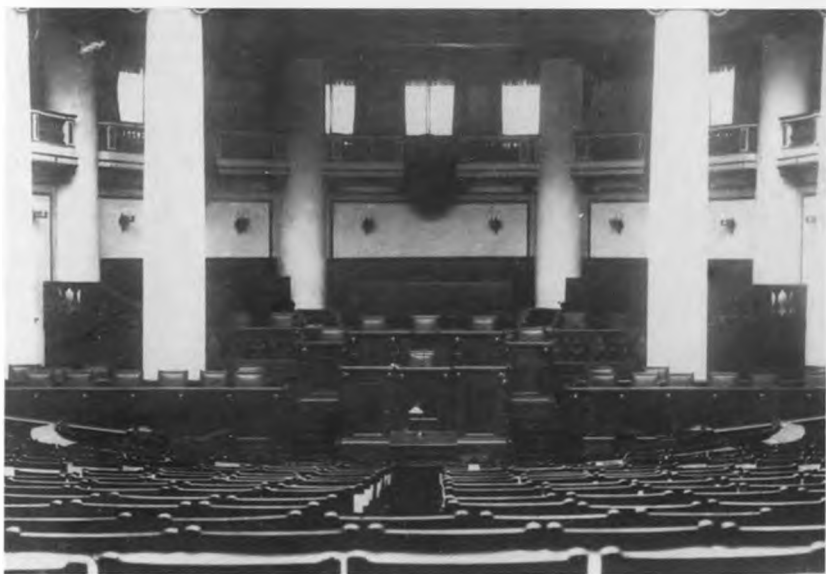
Общий вид президиума Таврического дворца.