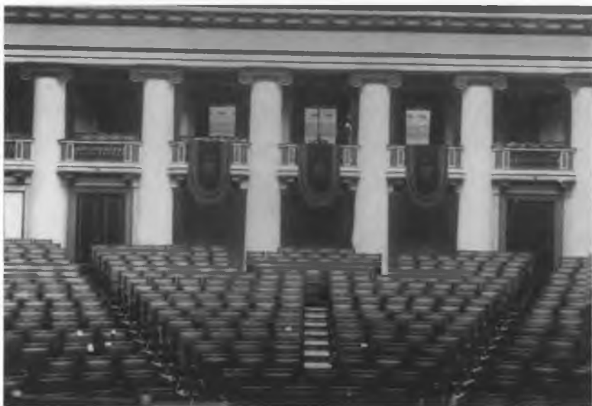
Общий вид зала Таврического дворца.