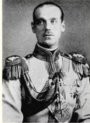
Великий князь Михаил Александрович