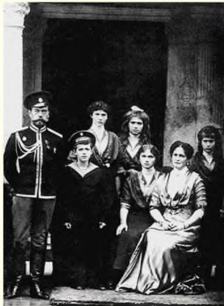
Николай II с женой и детьми