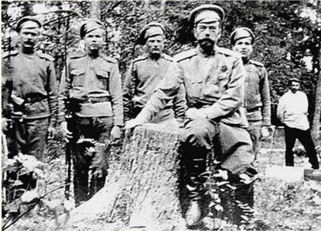
Николай II после отречения от престола под охраной в Царскосельском парке