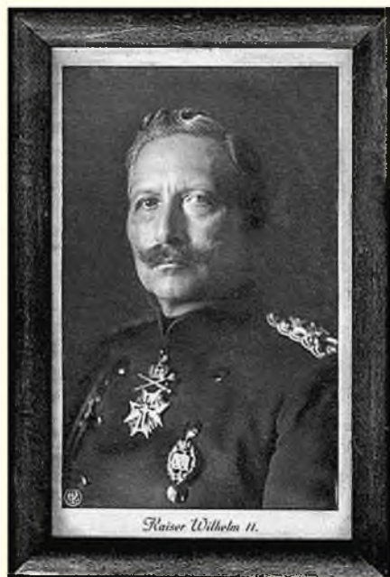
Германский император Вильгельм II