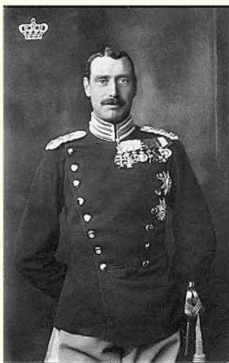
Датский король Христиан X