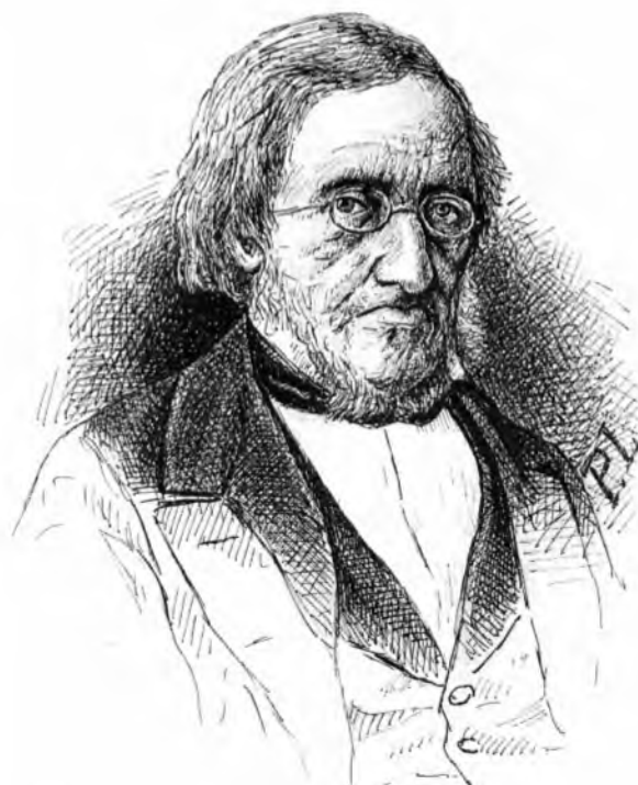
К.Э. фон Бер

Кончая обзор этой главы русской науки, нужно указать на гениальные работы по структуре кристаллов,