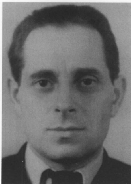
Садчиков Н. Г. Начальник Главного управления по делам литературы и издательств. Уполномоченный СНК СССР по охране военных тайн в печати. 1938—1946 гг.