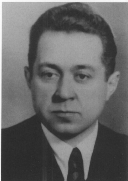
Омельченко К. К. Уполномоченный Совета Министров СССР по охране военных тайн в печати. 1946—1953 гг. Начальник Главного управления по охране военных и государственных тайн в печати МВД СССР. 1953 г. (март—октябрь). Начальник Главного управления по охране военных и государственных тайн в печати при Совете Министров СССР. 1953—1957 гг.