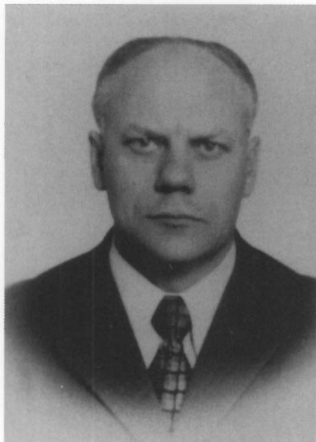
Болдырев В. А. Начальник Главного управления по охране военных и государственных тайн в печати при Совете Министров СССР. 1986–1990 гг. Начальник Управления охраны тайн в печати и СМИ при Совете Министров СССР (ГУОТ). 1990–1991 гг. Председатель Агентства по защите государственных секретов в средствах массовой информации. 25 июля– 25 декабря 1991 г.