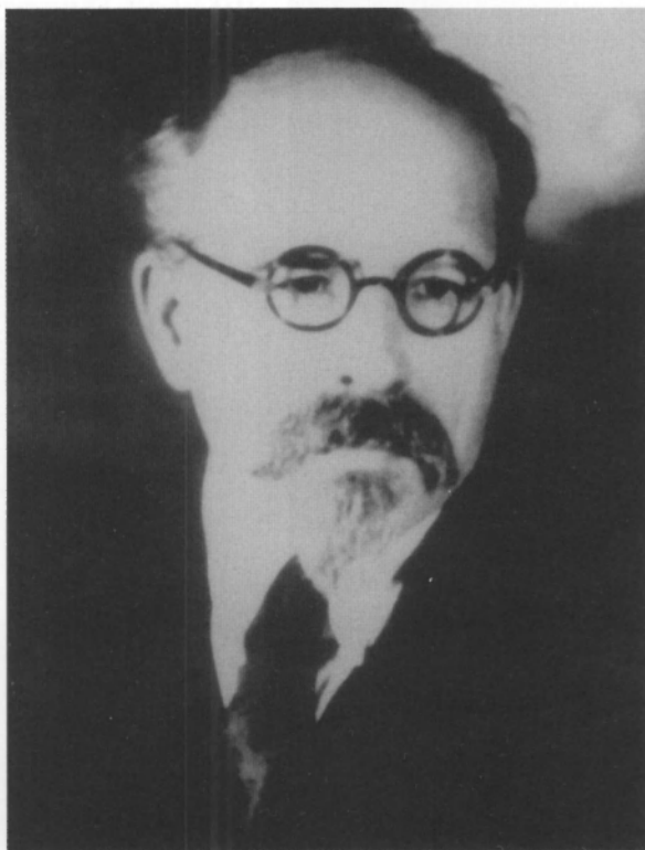
Лебедев-Полянский П. И. Начальник Главного управления по делам литературы и издательств Наркомпроса РСФСР (Главлит). 1922–1931 гг.