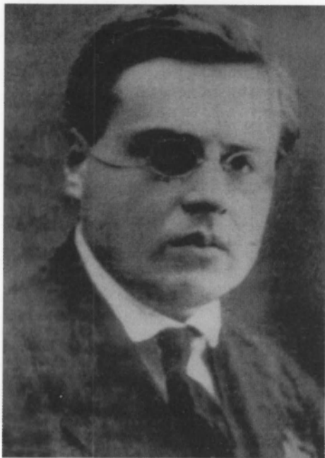
Волин Б. В. Начальник Главного управления по делам литературы и издательств Наркомпроса РСФСР (Главлит). 1931–1935 гг. Уполномоченный СНК СССР по охране военных тайн в печати. 1932–1935 гг.