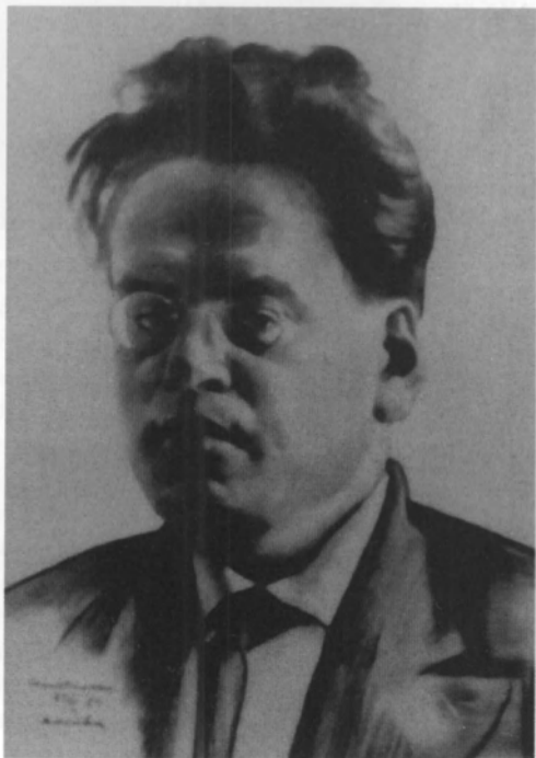
Волин Б. В. Художник Е. А. Кацман. [1924 г.]. РГАЛИ. Ф. 2368. Оп. 2. Д. 15. Л. 13.