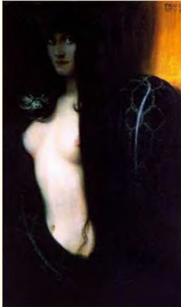
Грех. Франц фон Штук.

Тантрическая символика изображает Кундалини в виде змеи, открывающей секретное, потенциально опасное знание. Аналогичную символику мы находим в еретической интерпретации гностиков мифа о змее в райском саду. Змей, считающийся у ортодоксальных христиан Дьяволом, понимался некоторыми гностиками как божественная София, принявшая форму змеи, дабы даровать людям бессмертие и возможность «быть как боги».