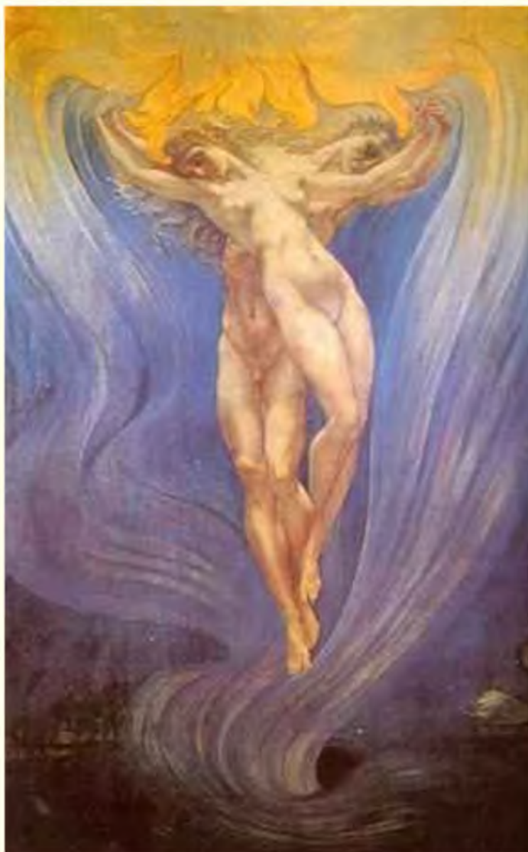
[Иллюстрация: L'amour Des Ames. (Любовь Душ). Жан Дельвиль]

руки. Пожалуй, самый лучший на Западе исторический аналог инициации пути левой мы находим в древних эллинистических мистических школах, самая знаменитая из которых находилась в Элевсине. По всей видимости, там предпринимались некоторые попытки самоуправляемого внутреннего развития, аналогичные тем, о которых мы пишем в этом исследовании.