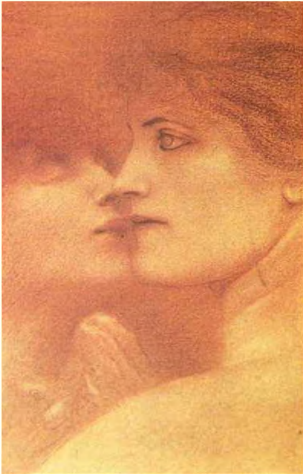
Поцелуй. Фернанд Хнопфф.

Хотя путь левой руки характеризуется взаимодействием двух контрасексуальных энергий — как