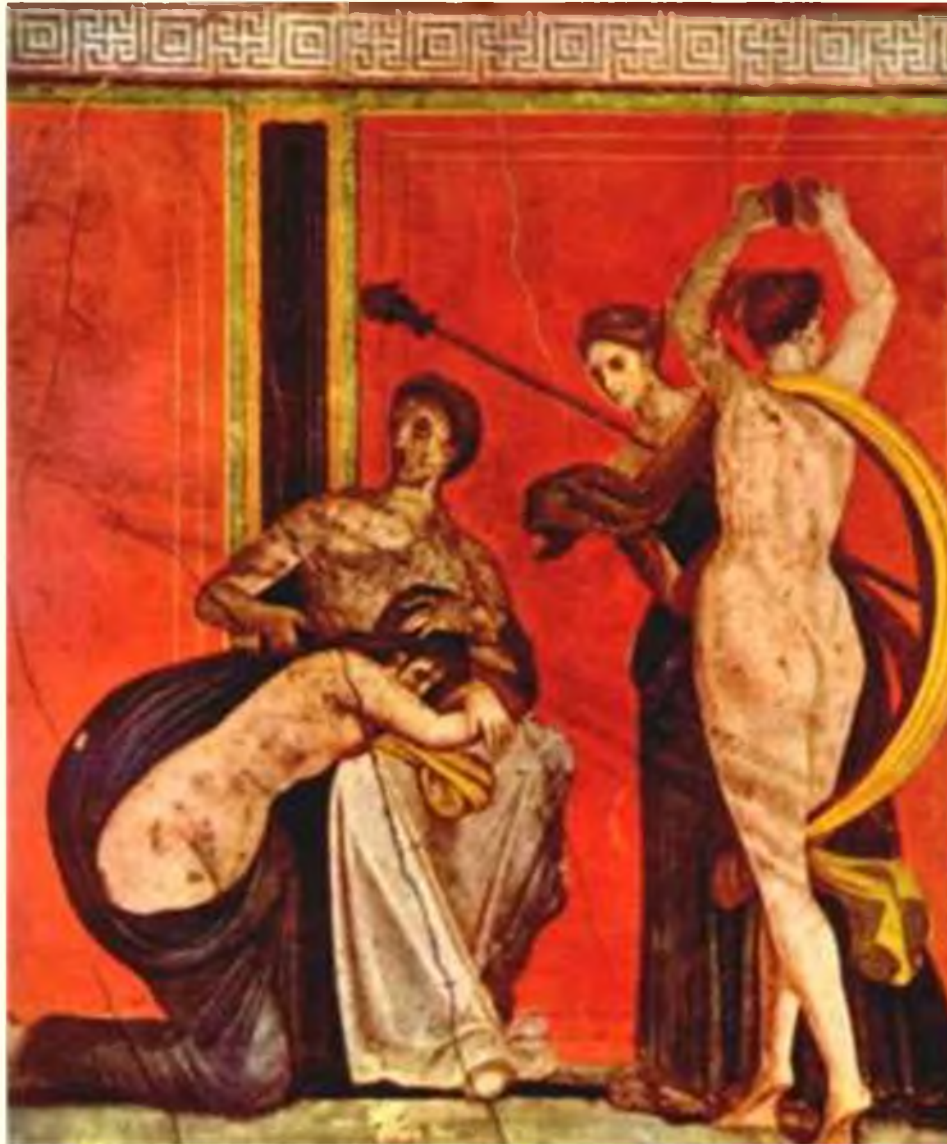
Ритуальное бичевание. Вилла Мистерий. Помпеи.