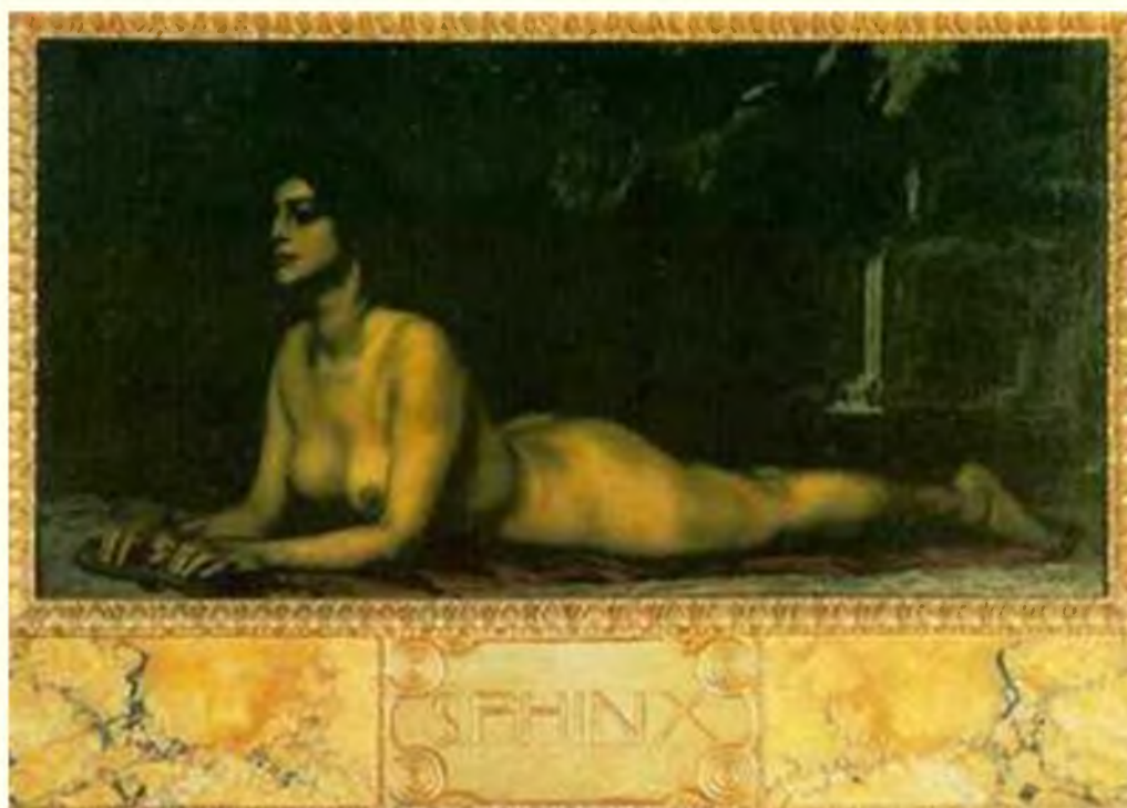
Сфинкс; Франц фон Штук

наделены загадочным даром магии, прорицания и других черных искусств. Сходство между скандинавской традицией вольвы, женщины-оракула, и культом змеи у предсказательниц Древней Греции свидетельствует о том, что еще с архаичных времен магическая сила мыслилась как имеющая изначально-женскую природу. Потому мужчины-адепты пути левой руки жаждут обрести в себе часть этой женской сути; и данная практика не ограничивалась одной Индией. К примеру, едва ли не во всех культурах шаманы традиционно используют женскую символику, каковая должна помочь им в их визионерских странствиях; это прекрасное доказательство в пользу универсальности принципов пути левой руки.