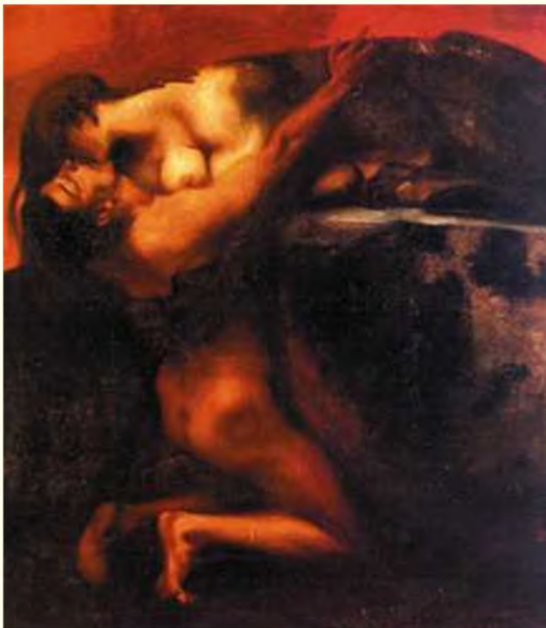
Поцелуй Сфинкса. Франц фон Штук.

плотском теле средство, открывающее путь к просветлению.