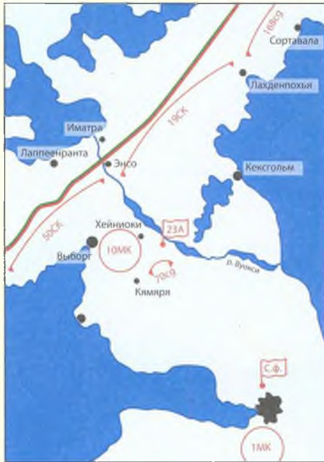
Карта № 6 Дислокация войск Северного фронта. Южный участок