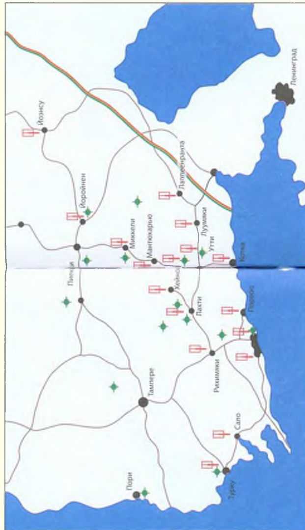
Карта № 12 Бомбардировка Финляндии 25 - 26 июня 1941 г.

Схема базирования советской бомбардировочной и финской истребительной авиации