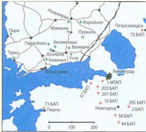
Карта № 11

Схема базирования советской бомбардировочной и финской истребительной авиации