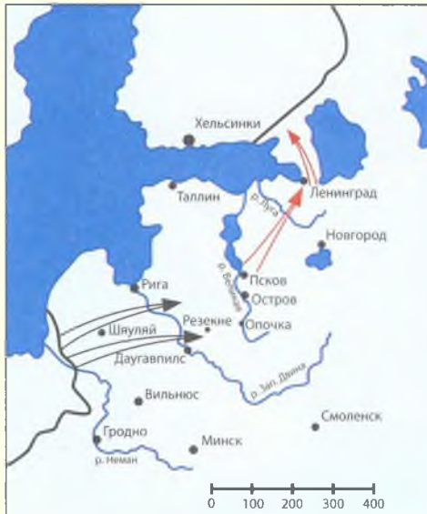
Карта № 8 Маршруты движения 4-й танковой группы вермахта, 1-го и 10-го мехкорпусов РККА 22 – 26 июня 1941 г.