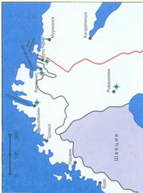
Карта № 9 Аэродромы в Заполярье