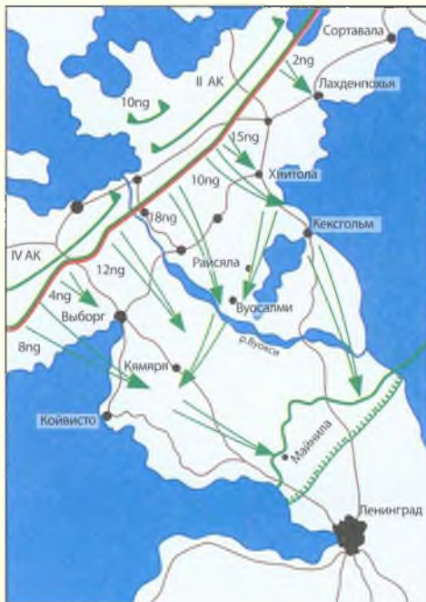
Карта № 15

Наступление финской армии на Карельском перешейке