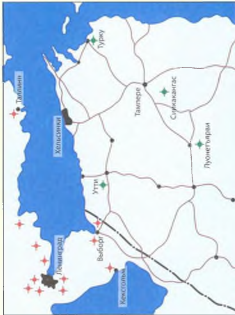
Карта № 10

Схема базирования финской бомбардировочной и советской истребительной авиации