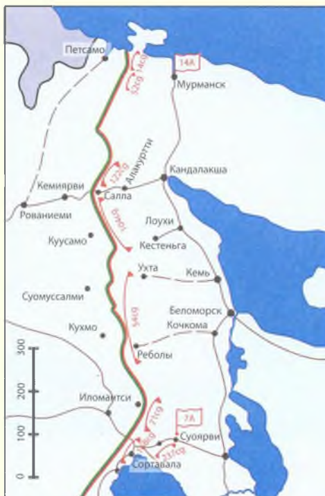
Карта № 7 Дислокация войск Северного фронта. Северный участок