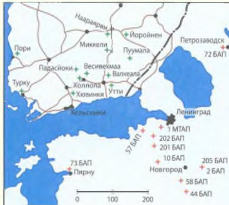
Карта № 11

Схема базирования финской бомбардировочной и советской истребительной авиации