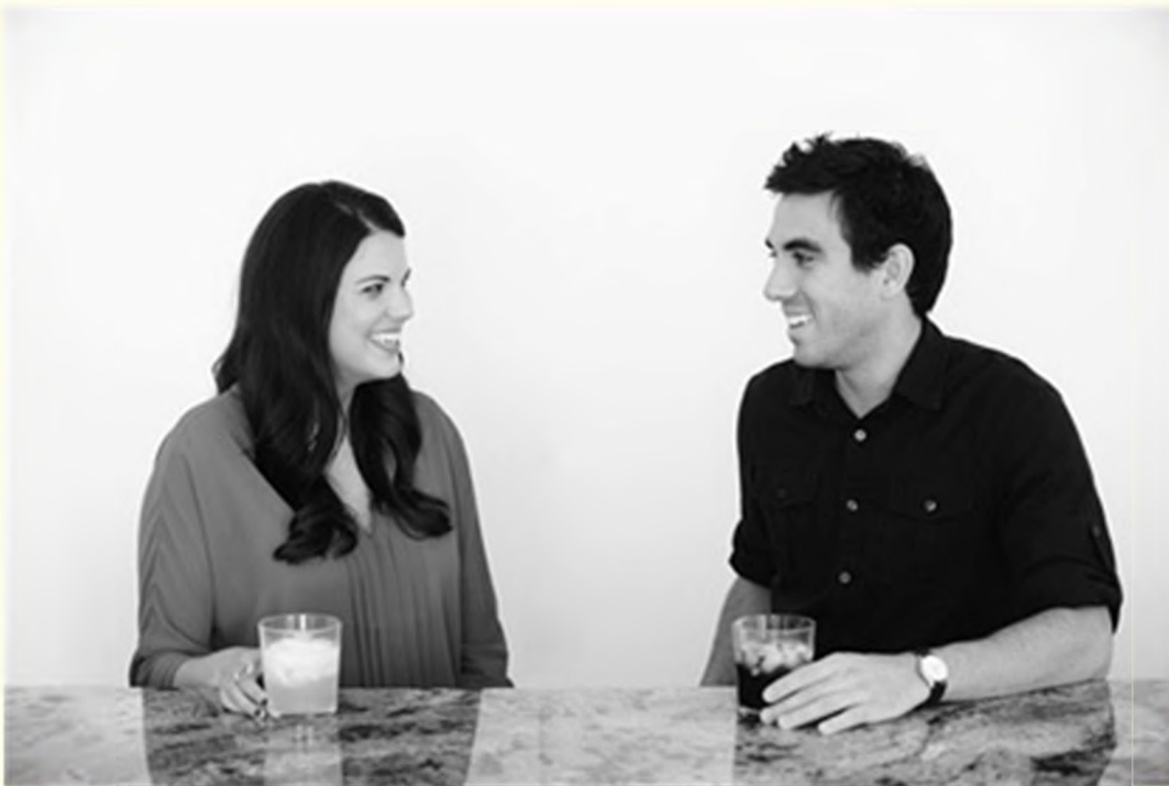
Последовательный разворот корпуса