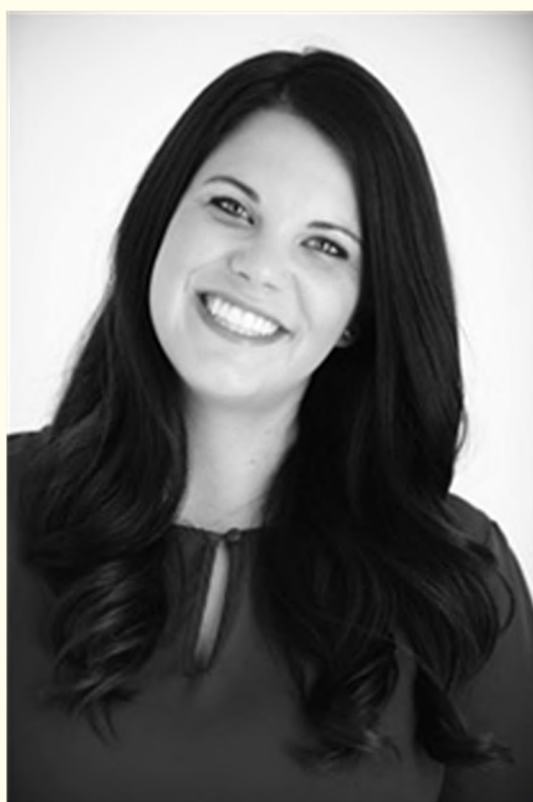
Наклон головы в сторону