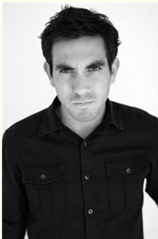
Сердитый городской взгляд

дже она продолжала смотреть на людей «сердитым городским взглядом». Этот недостаток типичен для тех, кто вырос в неблагополучных районах или даже просто в больших городах. Этот взгляд посылает всем встречным ясный сигнал о том, что вы враг, а не друг. Это - предостережение: не подходи ко мне! Хищники редко атакуют людей с таким сердитым взглядом, и в неблагополучных районах он необходим для выживания. Как только студентка сознательным усилием воли заставила себя посылать людям более дружелюбные сигналы, ей стало легче контактировать с другими студентами.