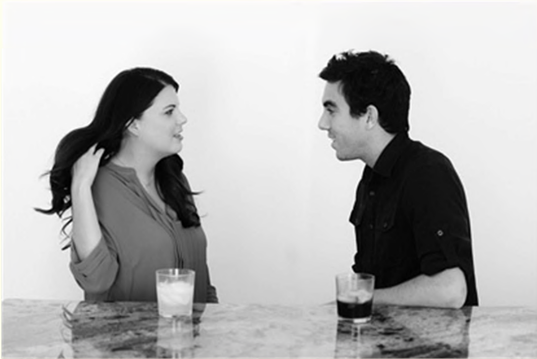
Отбрасывание пряди волос