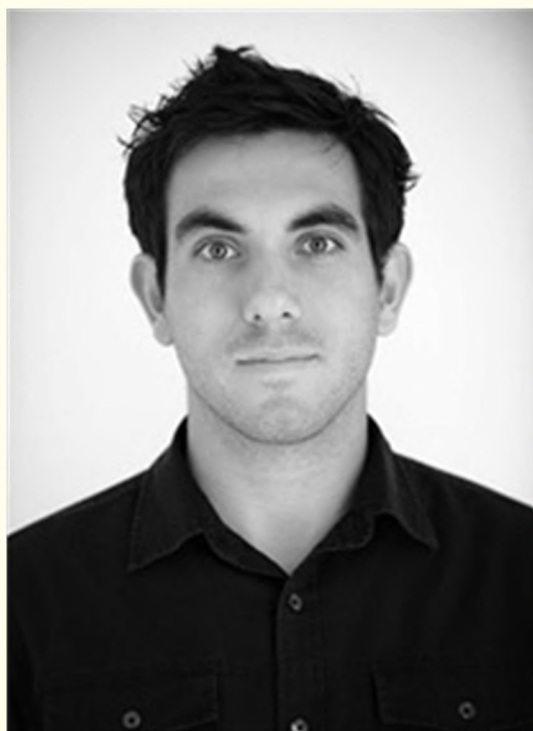
Неестественная игра бровями