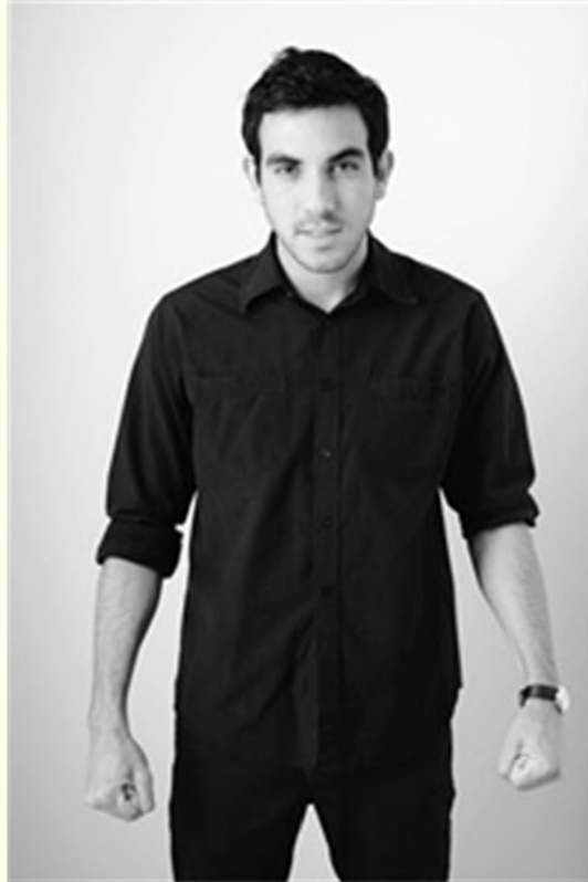
Поза готовности к нападению